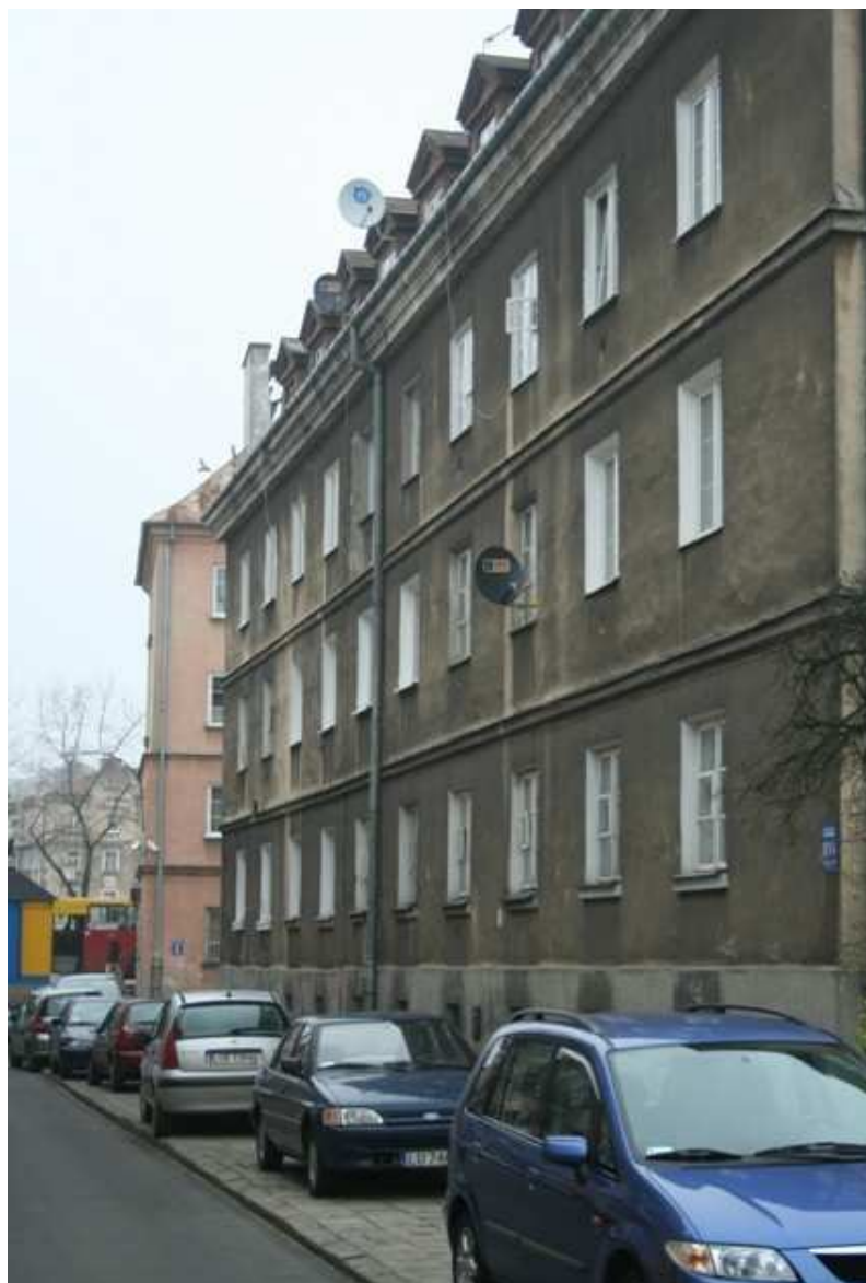
Furmańska 11, fot. Marcin Fedorowicz, 2010.