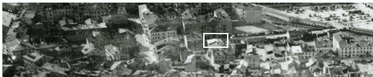
Fragment panoramy Lublina, lata 30., ul. Furmańska/A fragment of panorama of Lublin in the 1930s, Furmańska street,