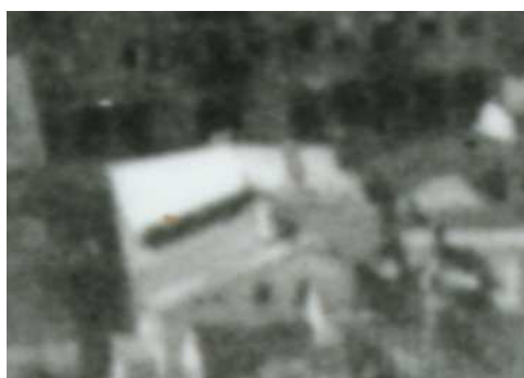
Fragment panoramy Lublina, lata 30., Furmańska 11/A fragment of panorama of Lublin in the 1930s, Furmańska 11,