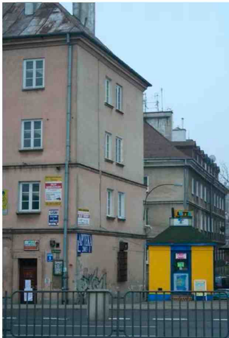
Furmańska 15a, fot. Marcin Fedorowicz, 2010.