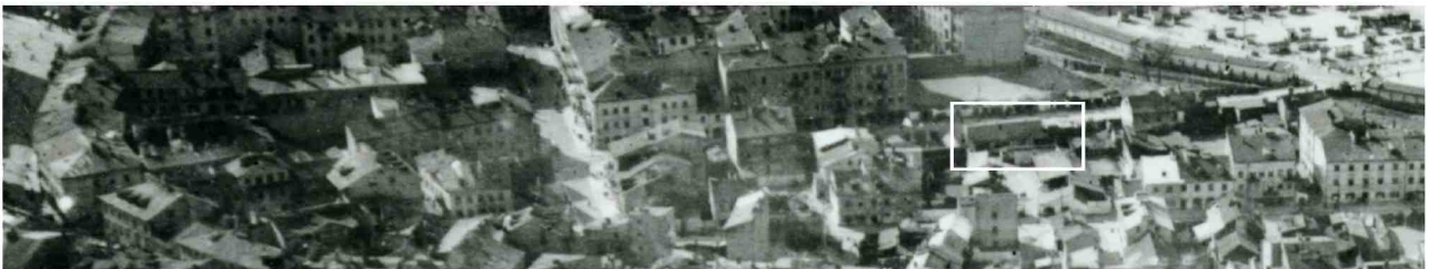
Fragment panoramy Lublina, lata 30., ul. Furmańska/A fragment of panorama of Lublin in the 1930s, Furmańska street,