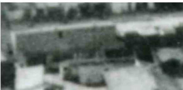
Fragment panoramy Lublina, lata 30., Furmańska 15a/A fragment of panorama of Lublin in the 1930s, Furmańska 15,