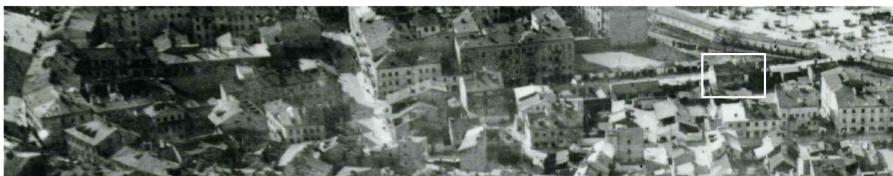
Fragment panoramy Lublina, lata 30., ul. Furmańska/A fragment of panorama of Lublin in the 1930s, Furmańska street,