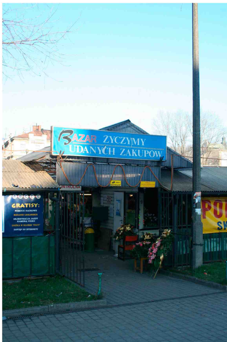
Furmańska 17, fot. Marcin Fedorowicz, 2010.