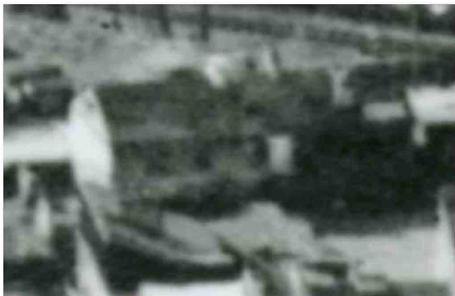
Fragment panoramy Lublina, lata 30., Furmańska 17/A fragment of panorama of Lublin in the 1930s, Furmańska 17,