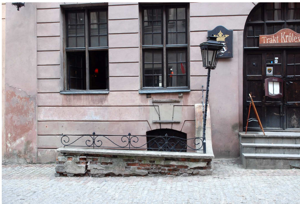
Detal, Grodzka 7, fot. Marcin Moszyński, 2010.