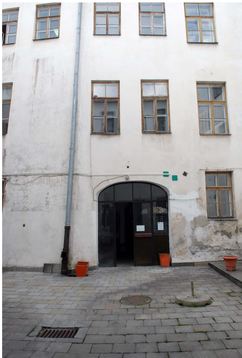
Podworko, Grodzka 7, fot. Marcin Moszyński, 2010.