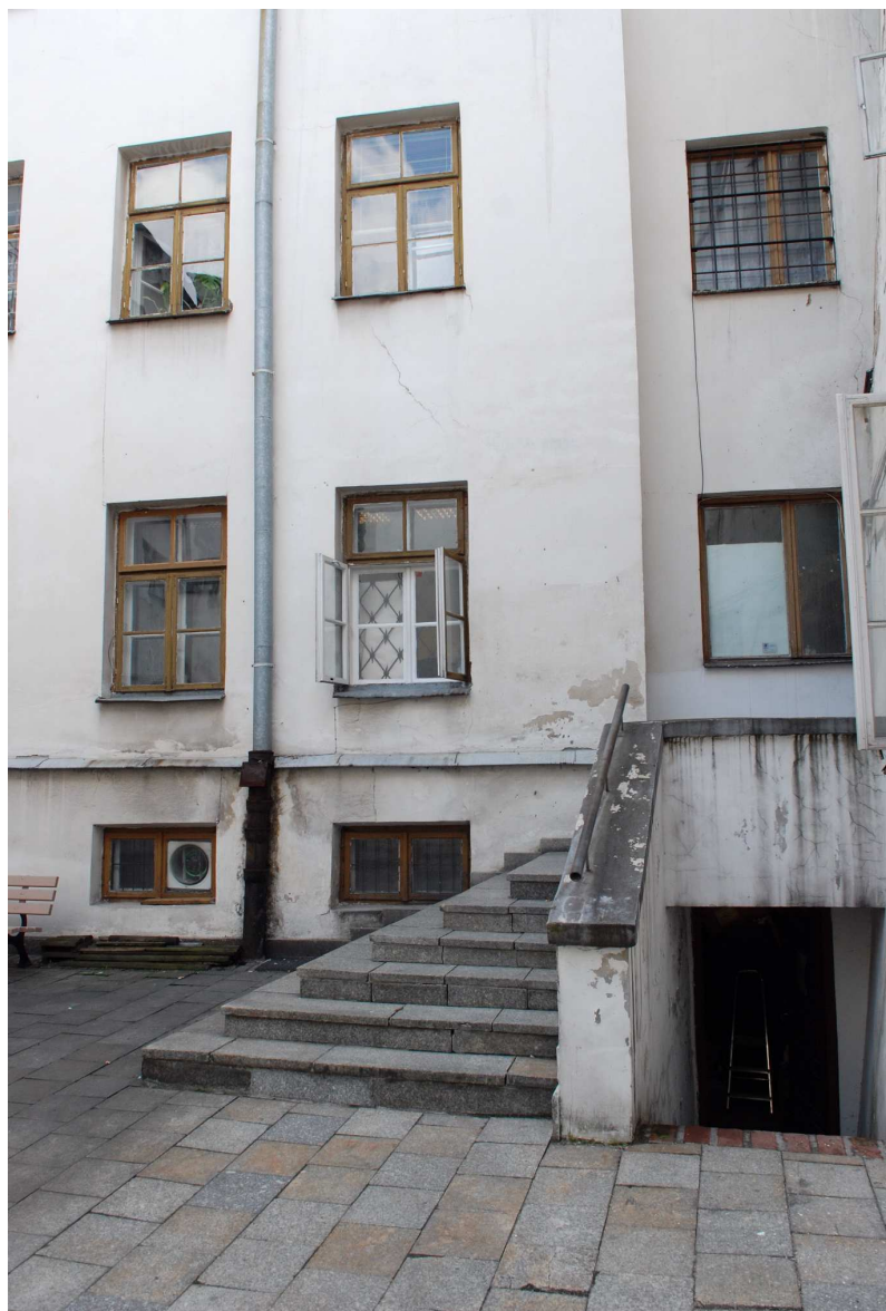
Podwórko, Grodzka 7, fot. Marcin Moszyński, 2010.