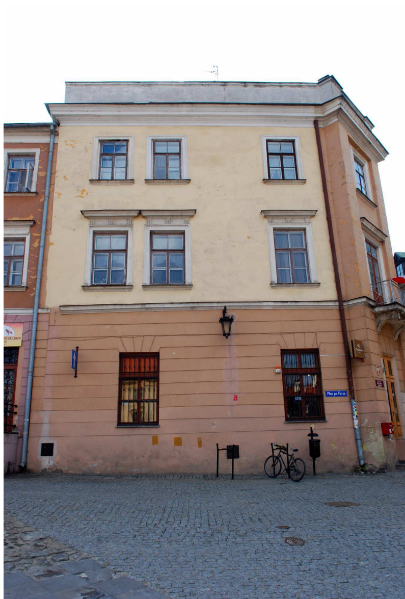
Fasada, widok z Placu po Farze, Grodzka 7, 2010.