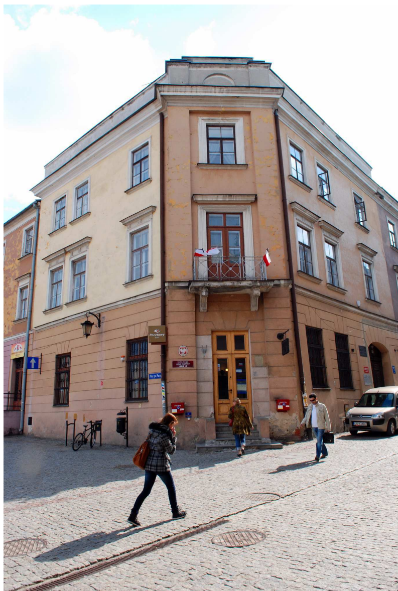
Fasada główna, Grodzka 7, fot. Marcin Moszyński, 2010.