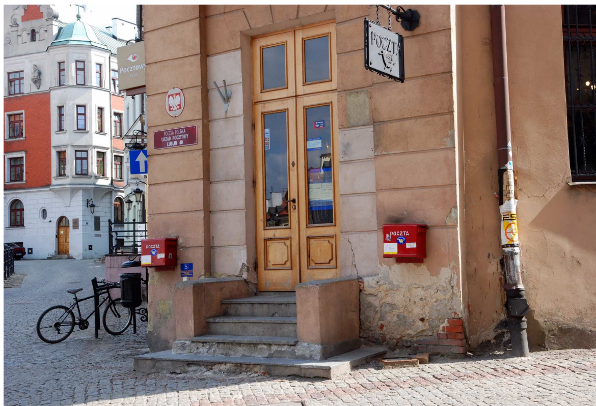
Wejście, Grodzka 7, fot. Marcin Moszyński, 2010.