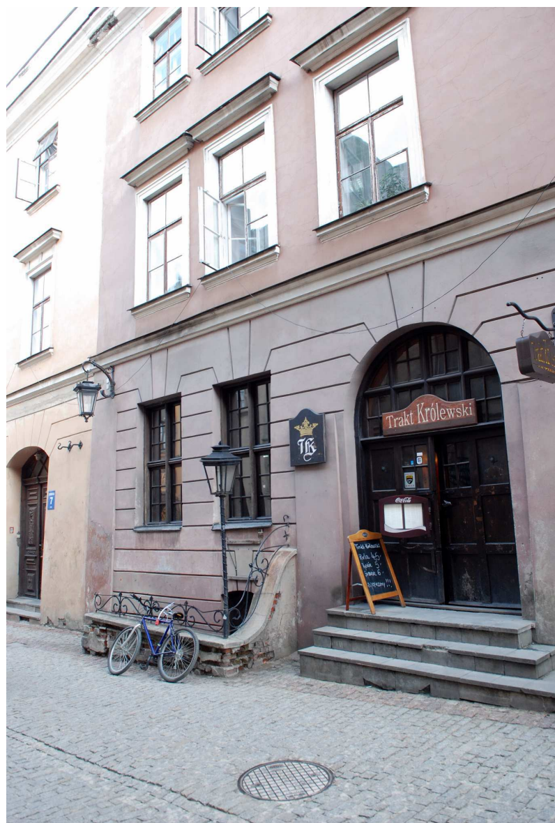
Fragment fasady, Grodzka 7, fot. Marcin Moszyński, 2010.