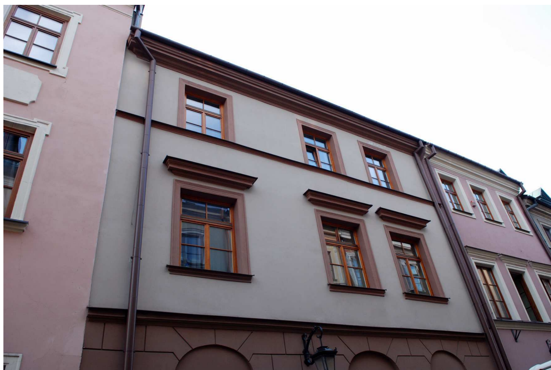
Fasada fragment, Grodzka 10, fot. Marcin Moszyński, 2010.