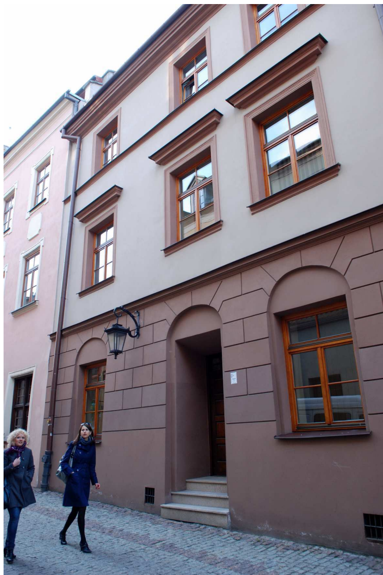
Fasada, Grodzka 10, fot. Marcin Moszyński, 2010.