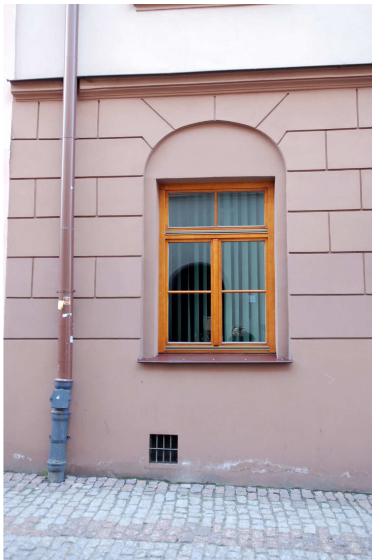
Detale, Grodzka 10, fot. Marcin Moszyński, 2010.