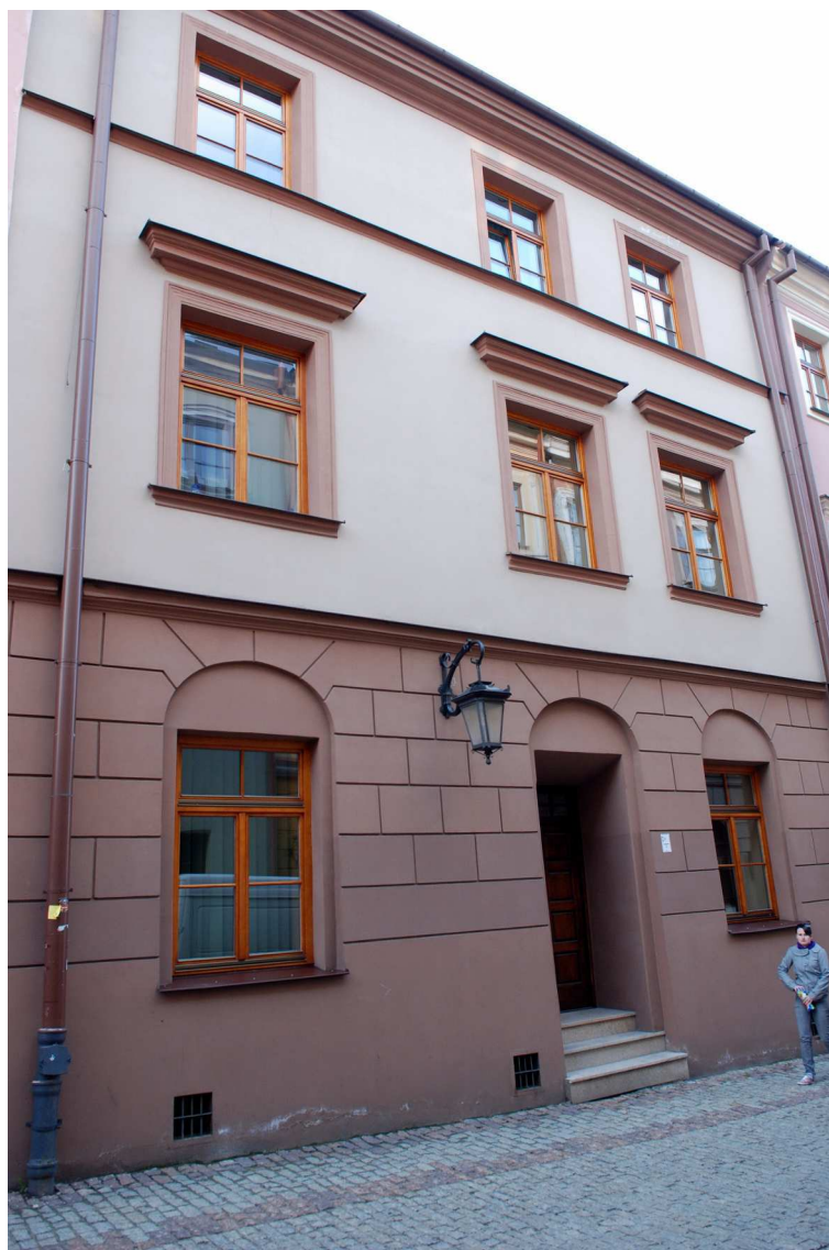
Fasada, Grodzka 10, fot. Marcin Moszyński, 2010.