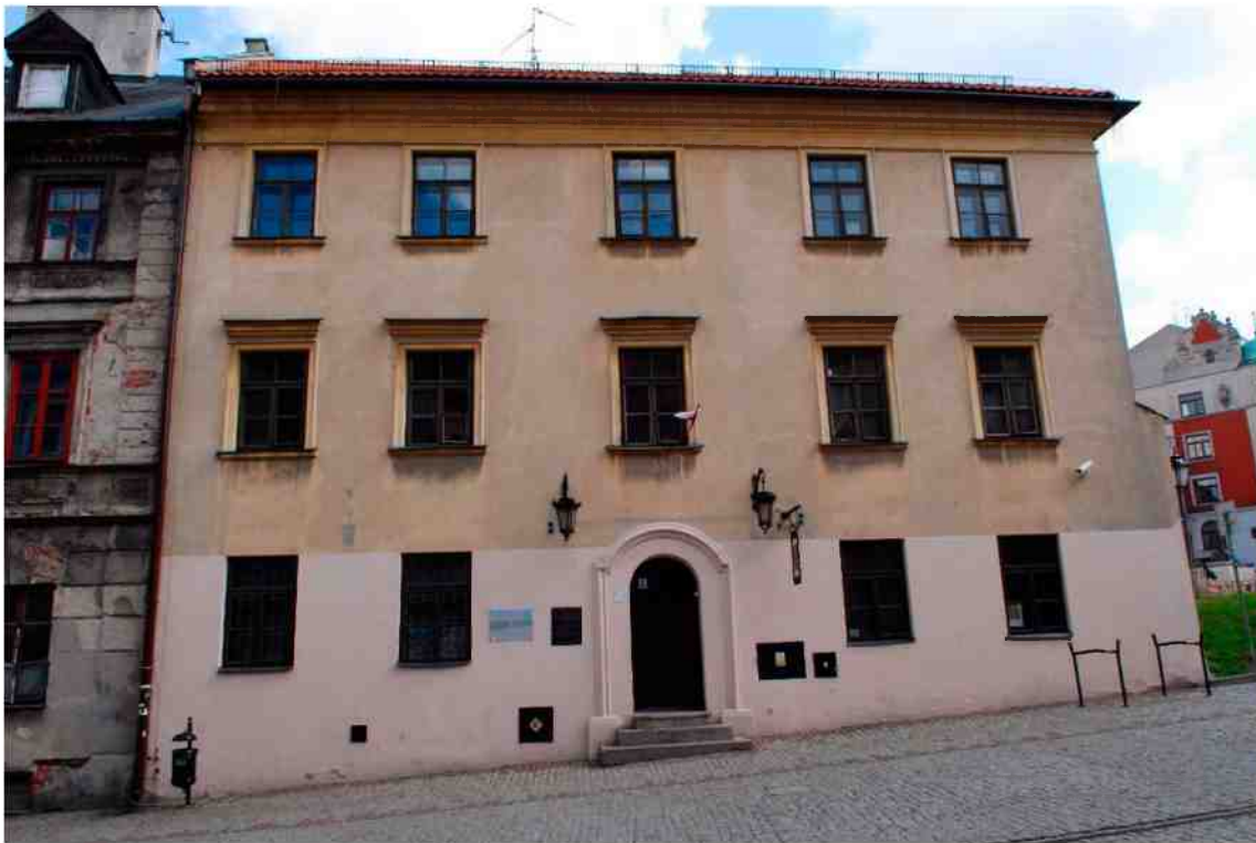
Fasada, Grodzka 11, fot. Marcin Moszyński, 2010.