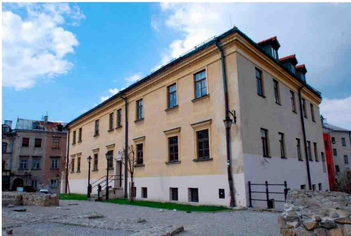
Elewacja boczna, Grodzka 11, fot. Marcin Moszyński, 2010.