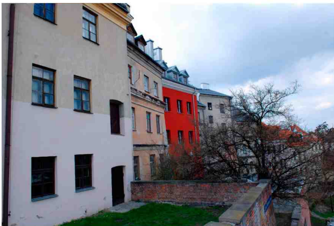
Elewacja tylna, Grodzka 11, fot. Marcin Moszyński, 2010.