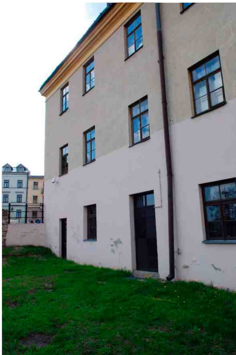
Elewacja tylna, Grodzka 11, fot. Marcin Moszyński, 2010.