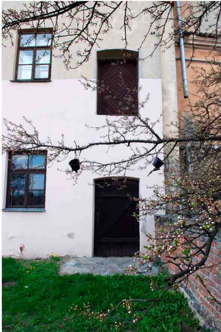
Elewacja tylna, Grodzka 11, fot. Marcin Moszyński, 2010.