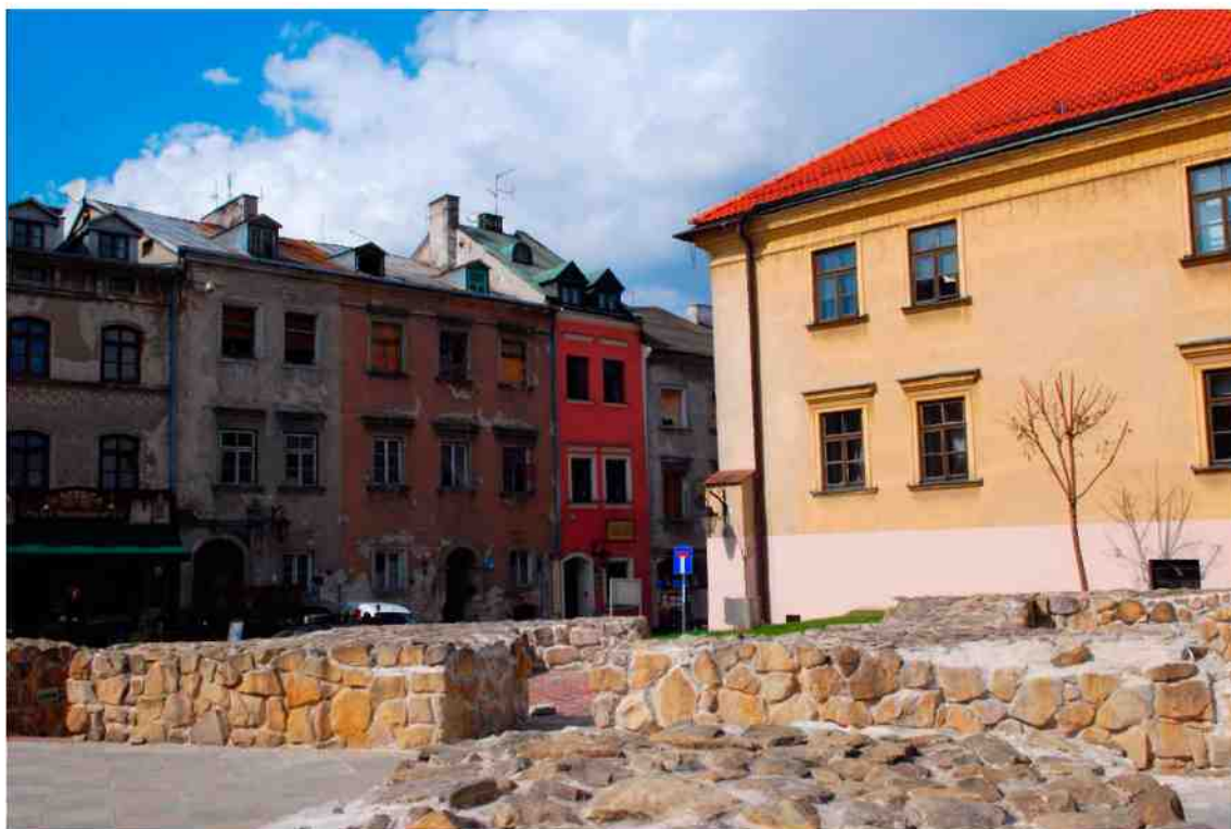
Elewacja boczna, Grodzka 11, fot. Marcin Moszyński, 2010.