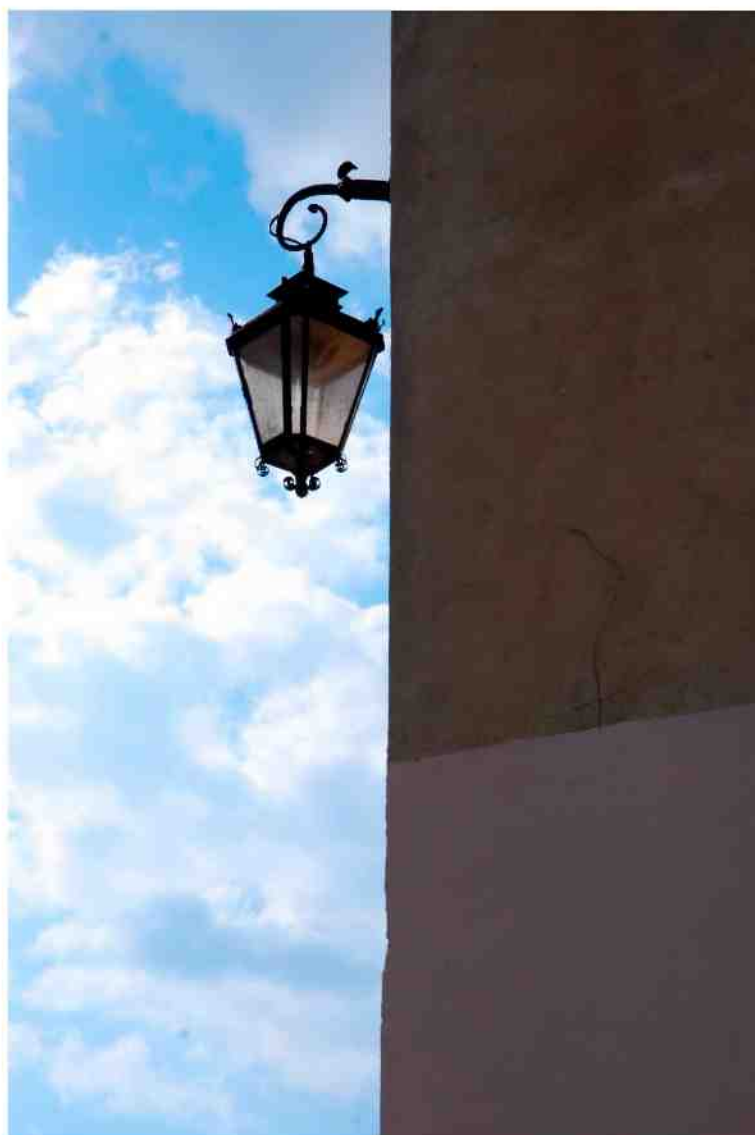
Fasada detale, Grodzka 11, fot. Marcin Moszyński, 2010.