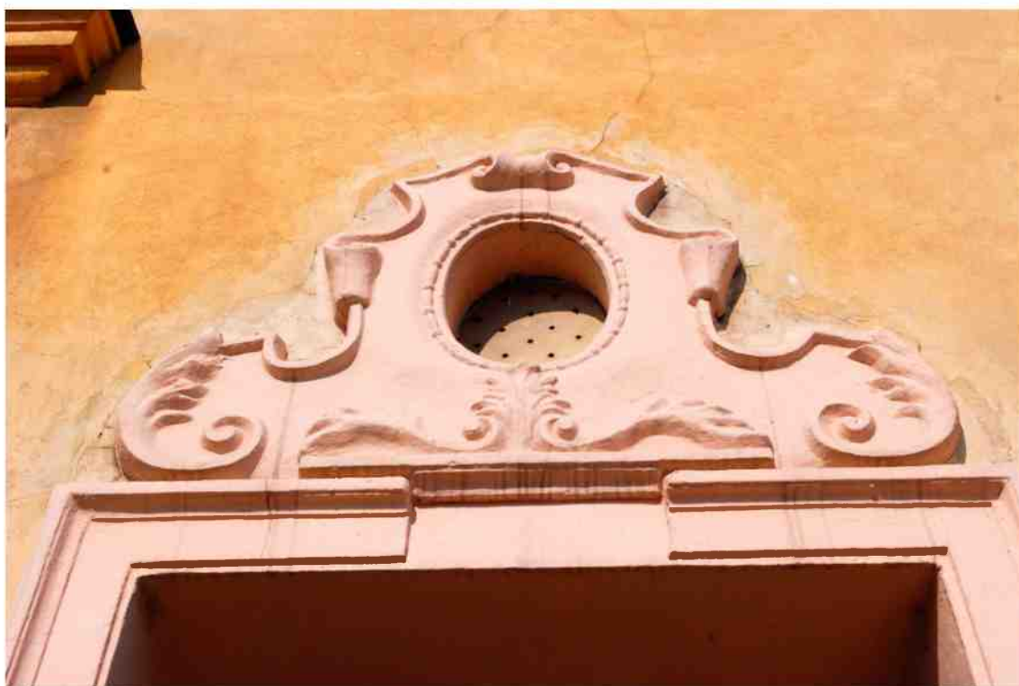
Elewacja boczna detale, Grodzka 11, fot. Marcin Moszyński, 2010.