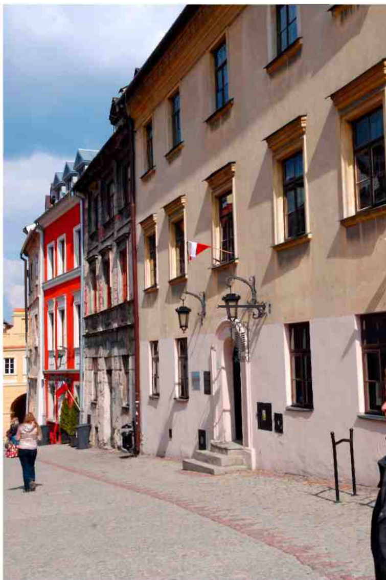
Fasada, Grodzka 11, fot. Marcin Moszyński, 2010.