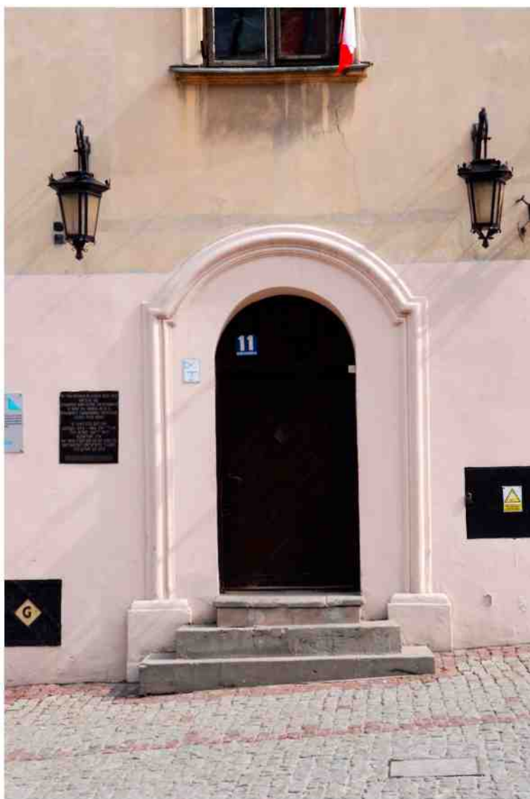
Fasada detale, Grodzka 11, fot. Marcin Moszyński, 2010.