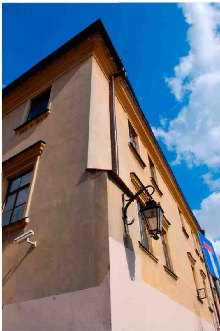
Fasada detale, Grodzka 11, fot. Marcin Moszyński, 2010.