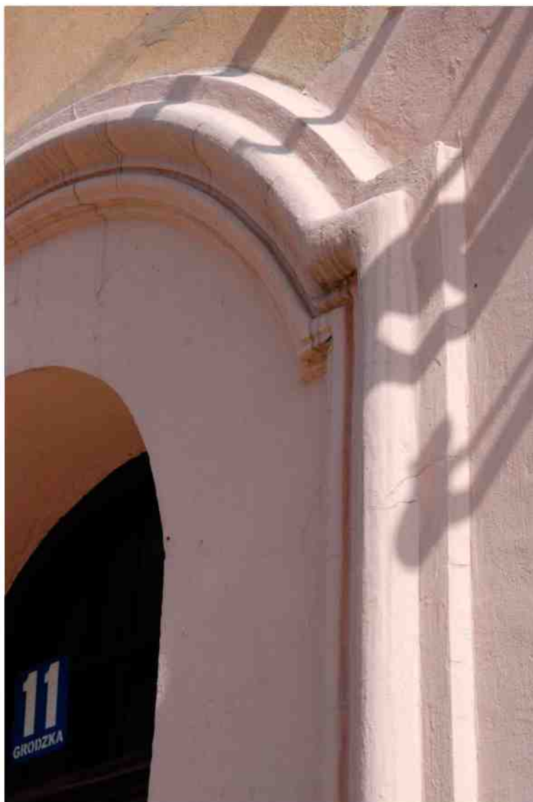
Fasada detale, Grodzka 11, fot. Marcin Moszyński, 2010.