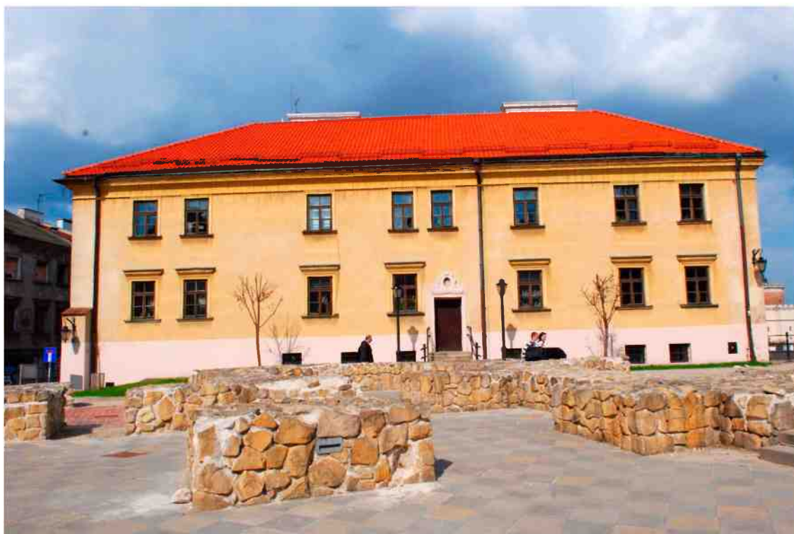
Elewacja boczna, Grodzka 11, fot. Marcin Moszyński, 2010.