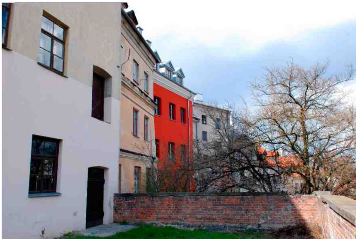
Elewacja tylna, Grodzka 11, fot. Marcin Moszyński, 2010.