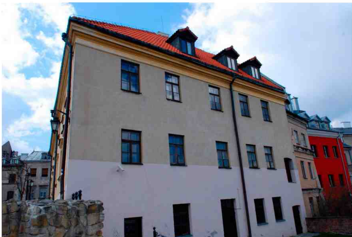
Elewacja tylna, Grodzka 11, fot. Marcin Moszyński, 2010.