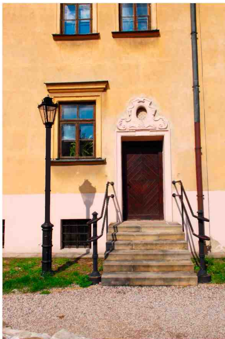
Elewacja boczna detale, Grodzka 11, fot. Marcin Moszyński, 2010.