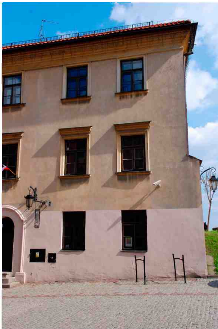
Fasada, Grodzka 11, fot. Marcin Moszyński, 2010.