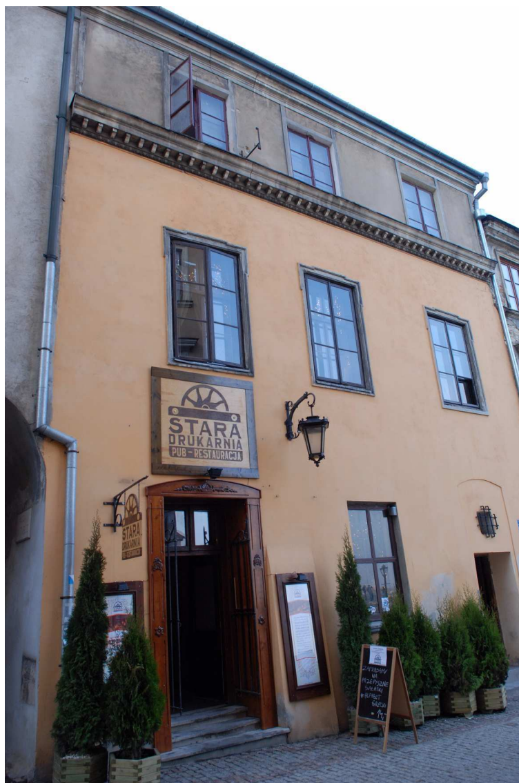
Fasada, Grodzka 16, fot. Marcin Moszyński, 2010.