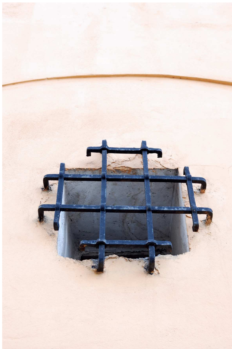
Detale, Grodzka 16, 2010.