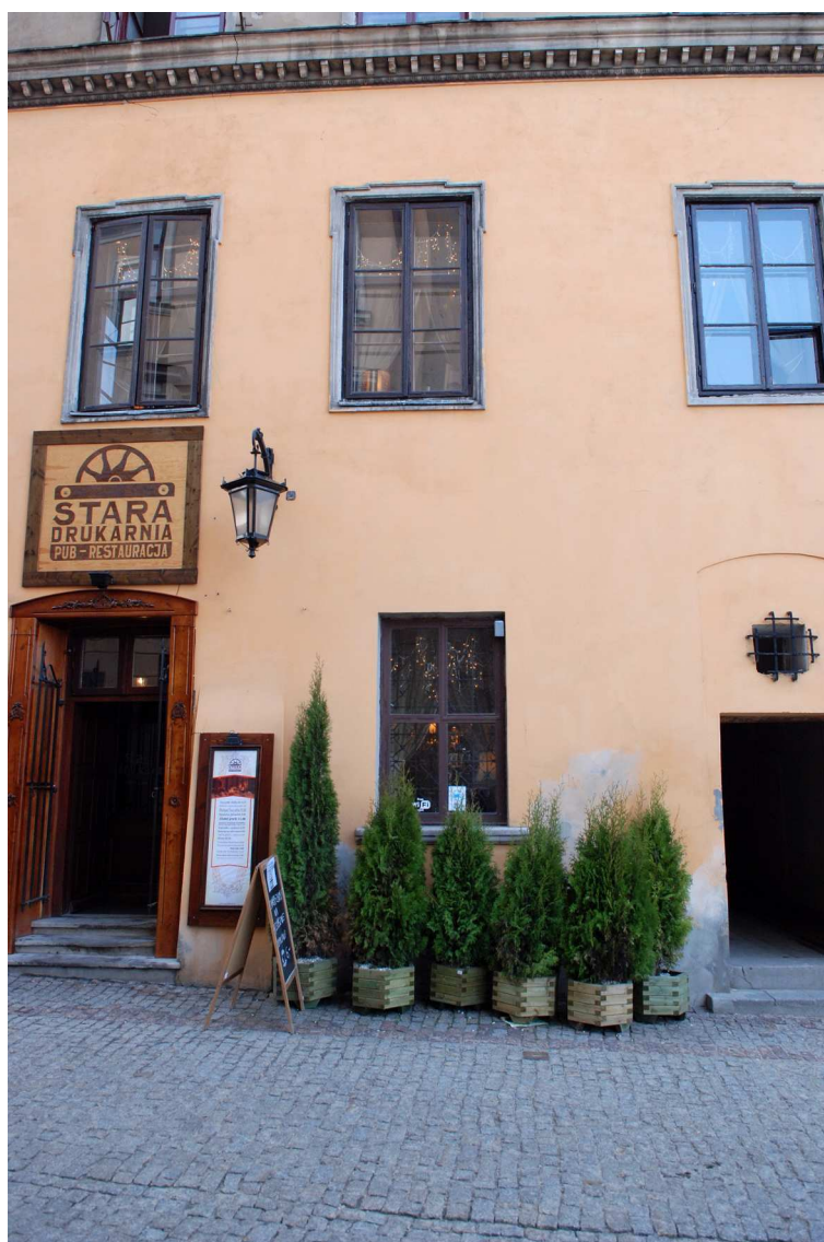
Fasada, Grodzka 16, 2010.