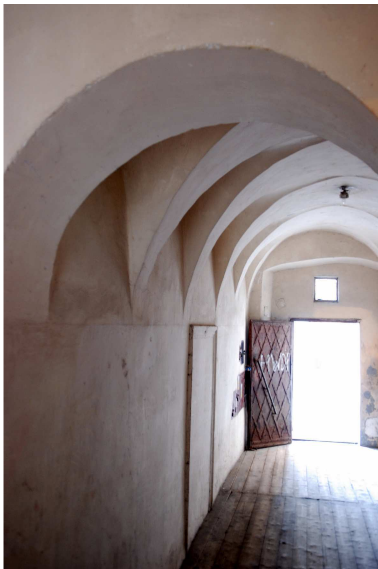
Sień, Grodzka 16, 2010.