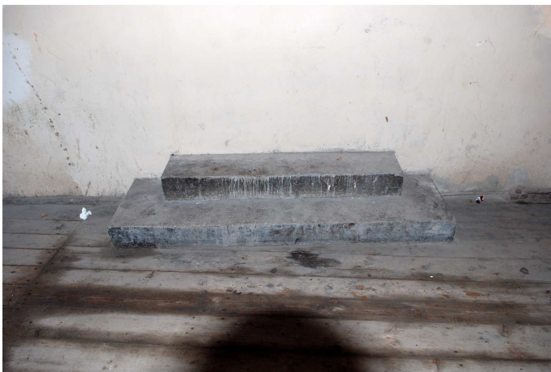
Detale, Grodzka 16, fot. Marcin Moszyński, 2010.