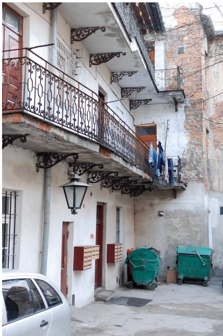
Podwórko, Grodzka 16, fot. Marcin Moszyński, 2010.