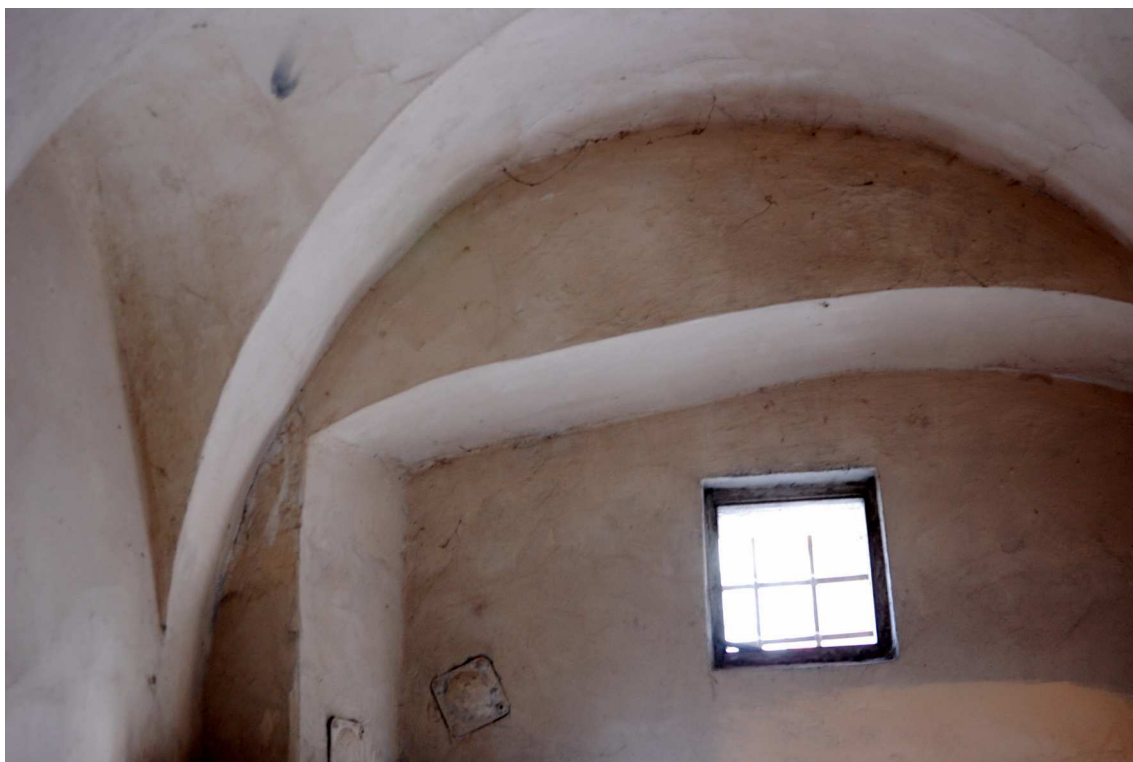
Sień, Grodzka 16, 2010.