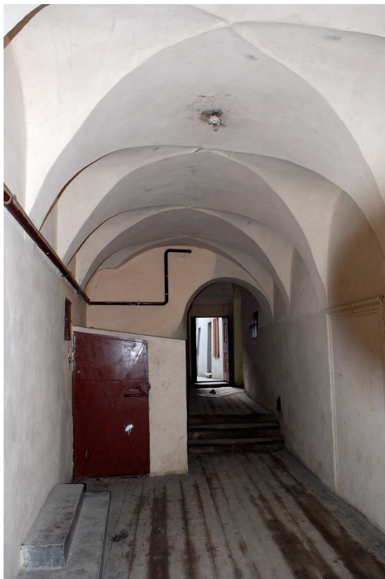
Sień, Grodzka 16, fot. Marcin Moszyński, 2010.