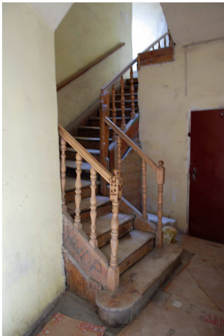
Klatka schodowa, Grodzka 16, fot. Marcin Moszyński, 2010.