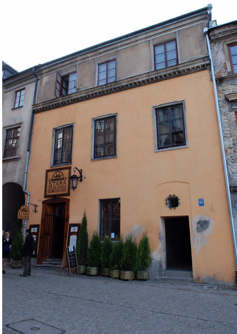
Fasada, Grodzka 16, fot. Marcin Moszyński, 2010.