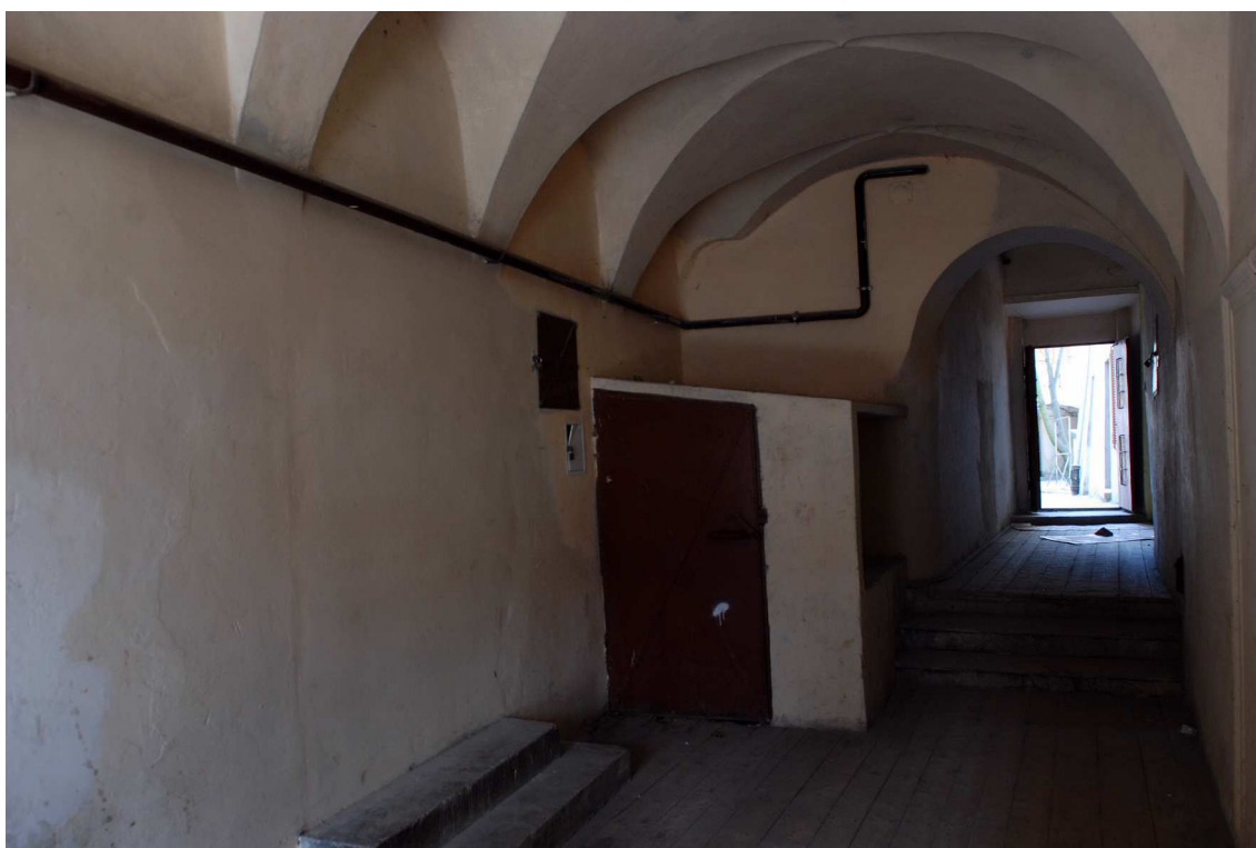
Sień, Grodzka 16, fot. Marcin Moszyński, 2010.