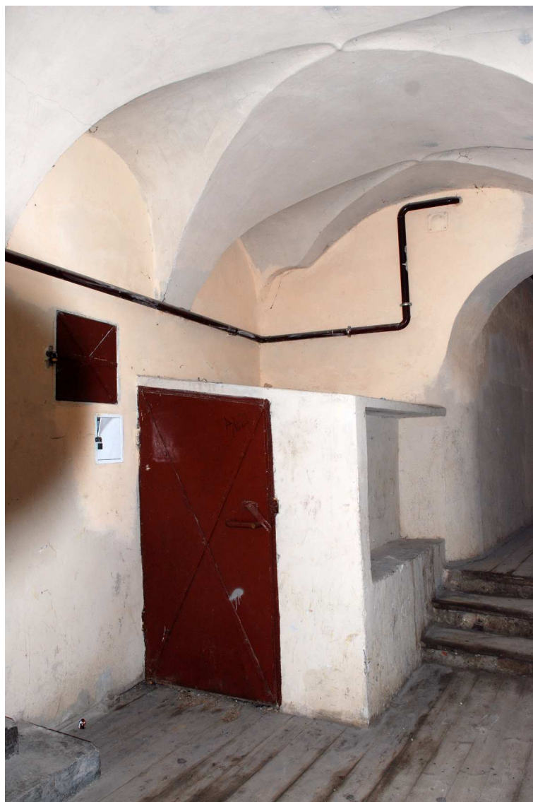
Sień, Grodzka 16, fot. Marcin Moszyński, 2010.