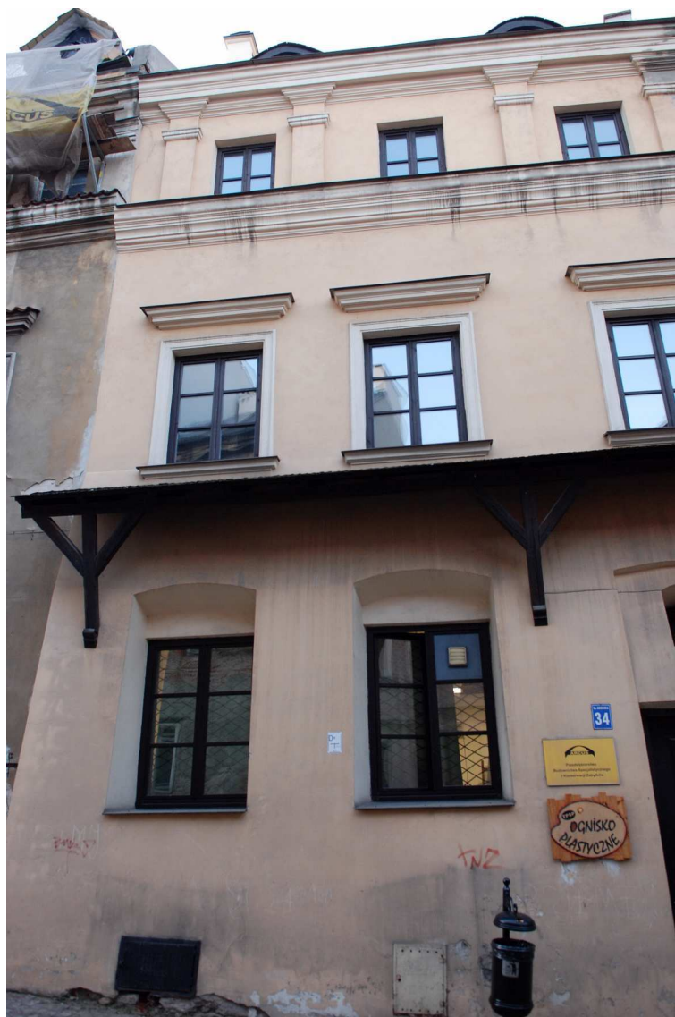
Fasada, Grodzka 34, fot. Marcin Moszyński, 2010.