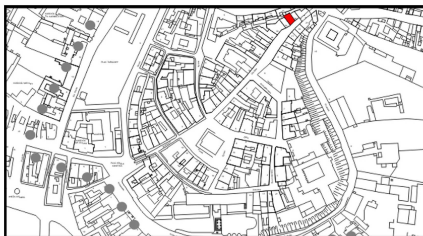
LOKALIZACJA NIERUCHOMOŚCI - Grodzka 34 LOCATION OF THE PROPERTY - Grodzka 34