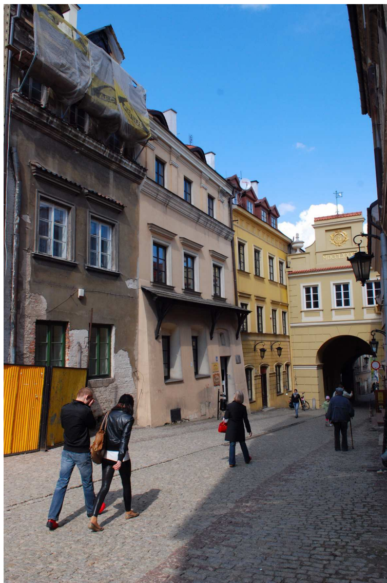
Fasada, Grodzka 34, fot. Marcin Moszyński, 2010.