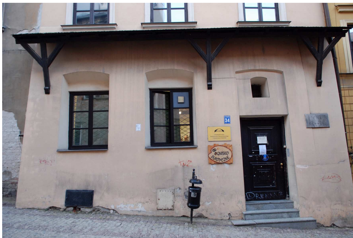
Fasada fragment, Grodzka 34, fot. Marcin Moszyński, 2010.