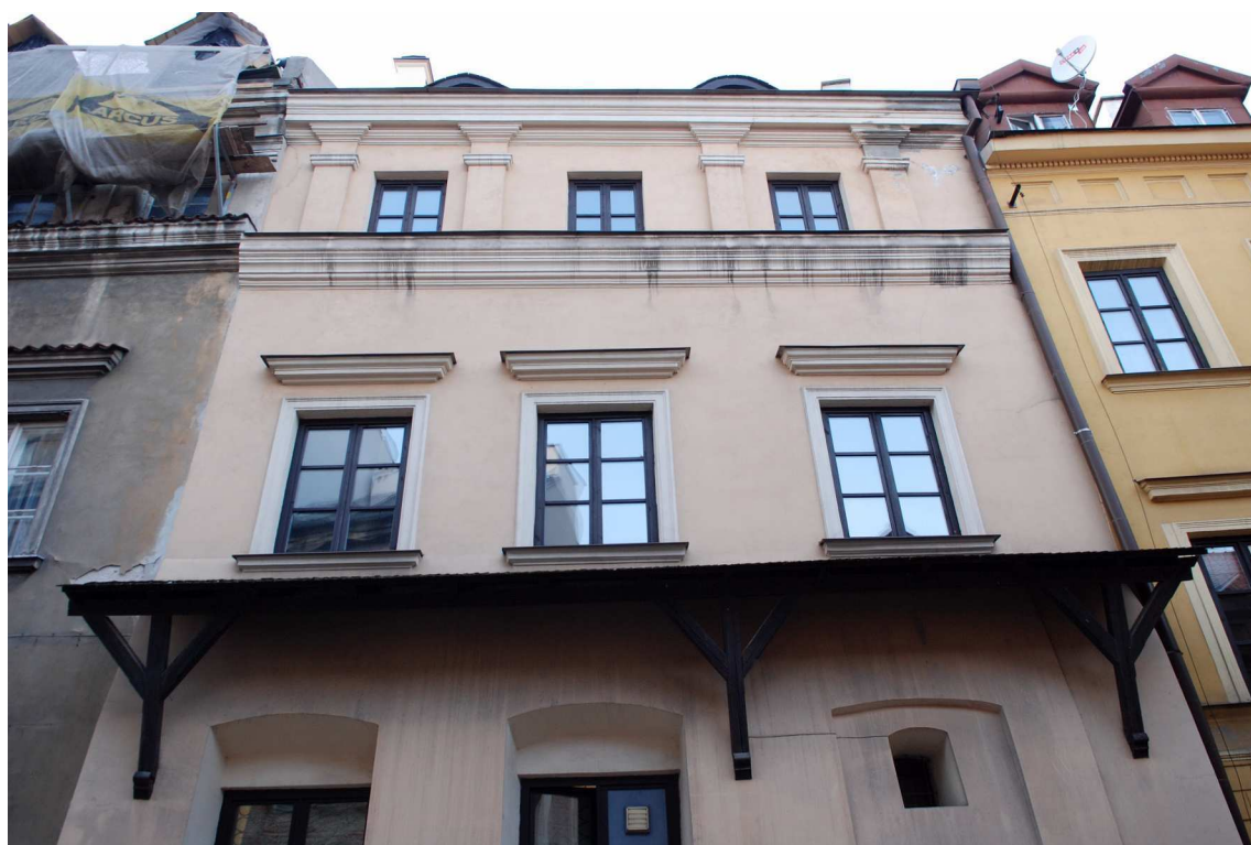
Fasada, Grodzka 34, 2010.