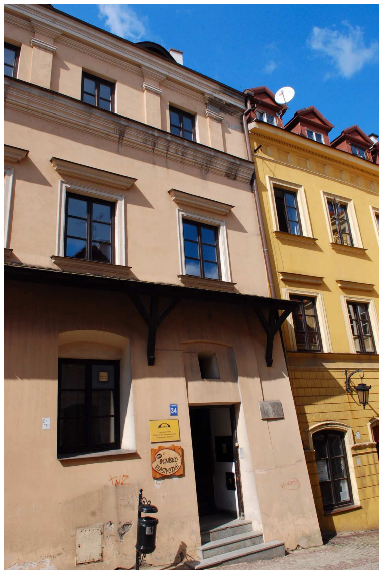
Fasada, Grodzka 34, 2010.