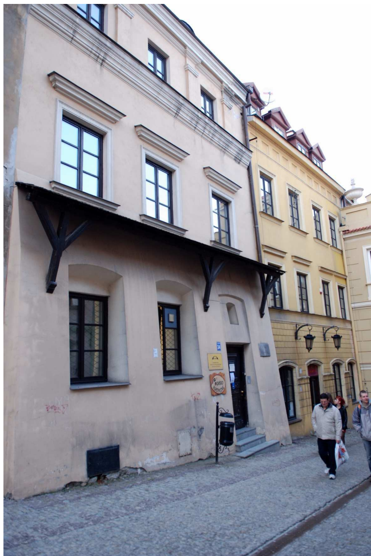
Fasada, Grodzka 34, fot. Marcin Moszyński, 2010.