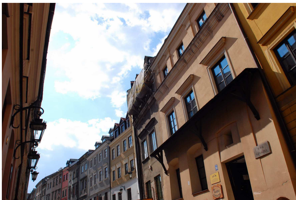
Fasada, Grodzka 34, fot. Marcin Moszyński, 2010.