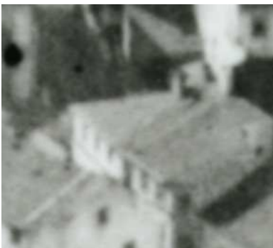
Fragment panoramy Lublina, lata 30., Jateczna 1/Szeroka 25/A fragment of panorama of Lublin in the 1930s, Jateczna 1/Szeroka 25,