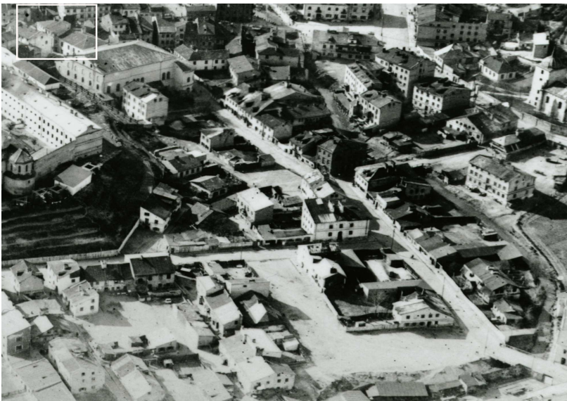
Fragment panoramy Lublina, lata 30., ul. Jateczna/A fragment of panorama of Lublin in the 1930s, Jateczna street,