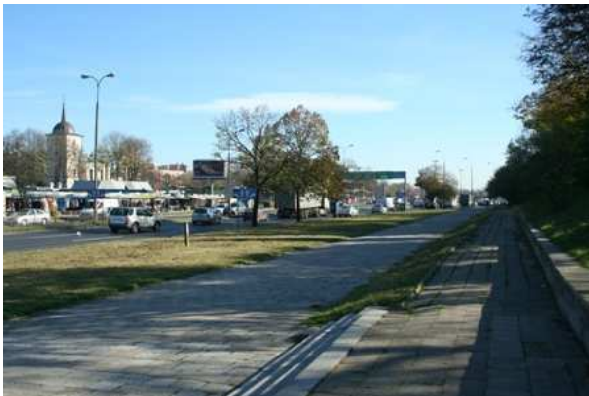
Jateczna 1/Szeroka 25, fot. Marcin Fedorowicz, 2010.