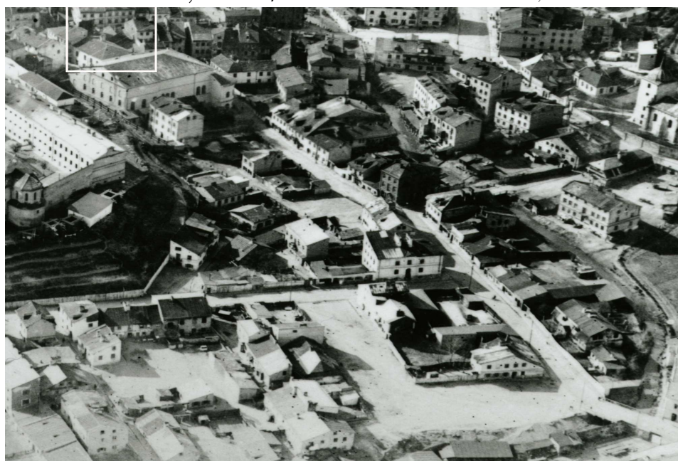
Fragment panoramy Lublina, lata 30., ul. Jateczna/A fragment of panorama of Lublin in the 1930s, Jateczna street,