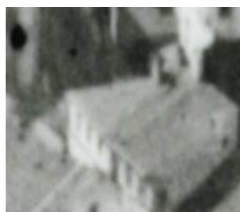
Fragment panoramy Lublina, lata 30., Jateczna 2/Szeroka 27/A fragment of panorama of Lublin in the 1930s, Jateczna 2/Szeroka 27,