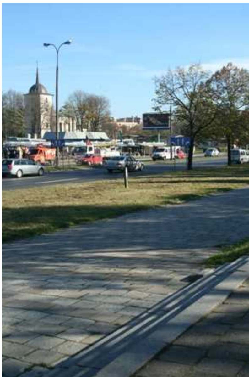
Jateczna 2/Szeroka 27, fot. Marcin Fedorowicz, 2010.