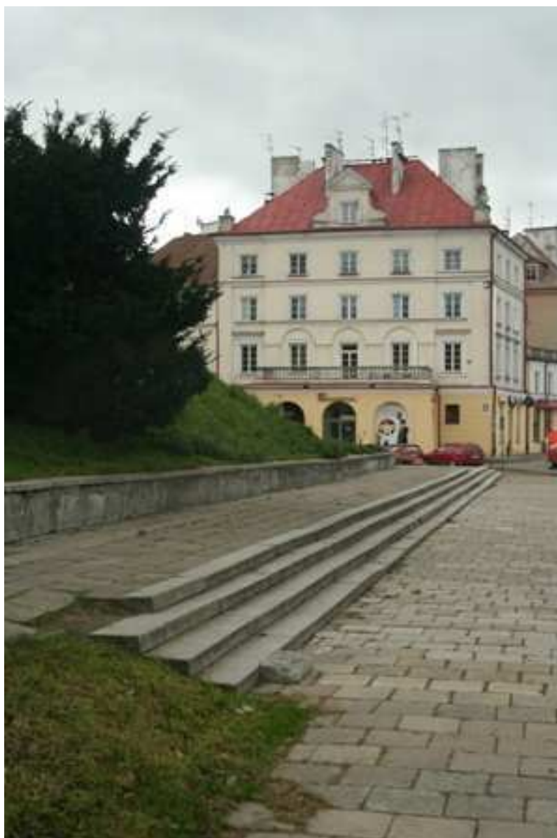
Jateczna 3, 2010.