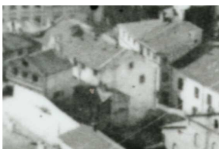
Fragment panoramy Lublina, lata 30., Jateczna 3/A fragment of panorama of Lublin in the 1930s, Jateczna 3,