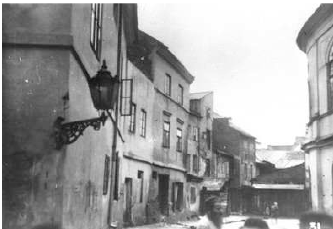
Jateczna 10, budynek trzeci od lewej, autor nieznany, 1939.