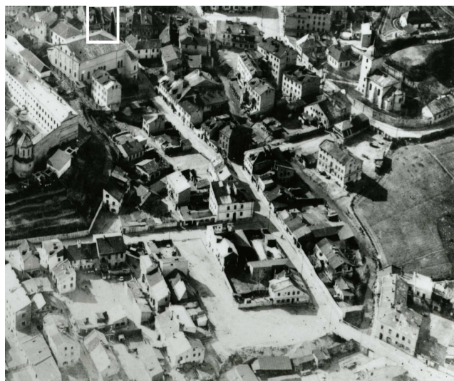
Fragment panoramy Lublina, lata 30., ul. Jateczna./A fragment of panorama of Lublin in the 1930s, Jateczna street,