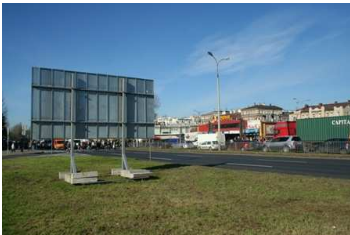
Jateczna 10, fot. Marcin Fedorowicz, 2010.