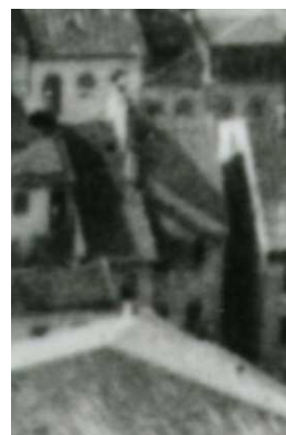
Fragment panoramy Lublina, lata 30., Jateczna 10./A fragment of panorama of Lublin in the 1930s, Jateczna 10,