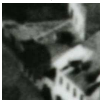
Fragment panoramy Lublina, lata 30., Jateczna 20./A fragment of panorama of Lublin in the 1930s, Jateczna 20,