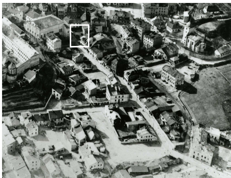
Fragment panoramy Lublina, lata 30., ul. Jateczna./A fragment of panorama of Lublin in the 1930s, Jateczna street,