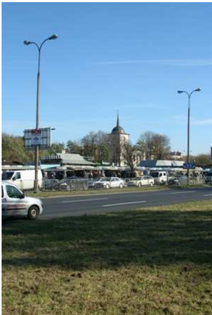
Jateczna 20, fot. Marcin Fedorowicz, 2010.