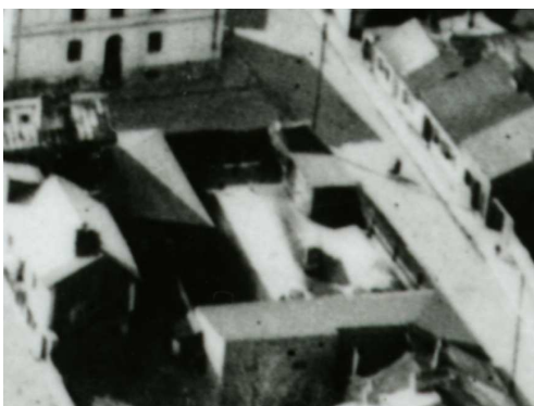
Fragment panoramy Lublina, lata 30., Jateczna 21/Krawiecka 57/A fragment of panorama of Lublin in the 1930s, Jateczna 21/Krawiecka 57,