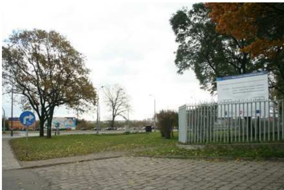
Jateczna 21, fot. Marcin Fedorowicz, 2010.