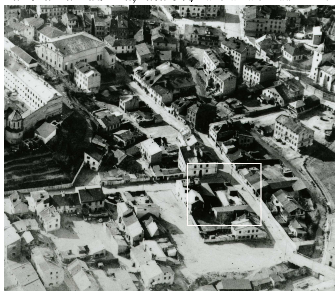
Fragment panoramy Lublina, lata 30., ul. Jateczna/A fragment of panorama of Lublin in the 1930s, Jateczna street,