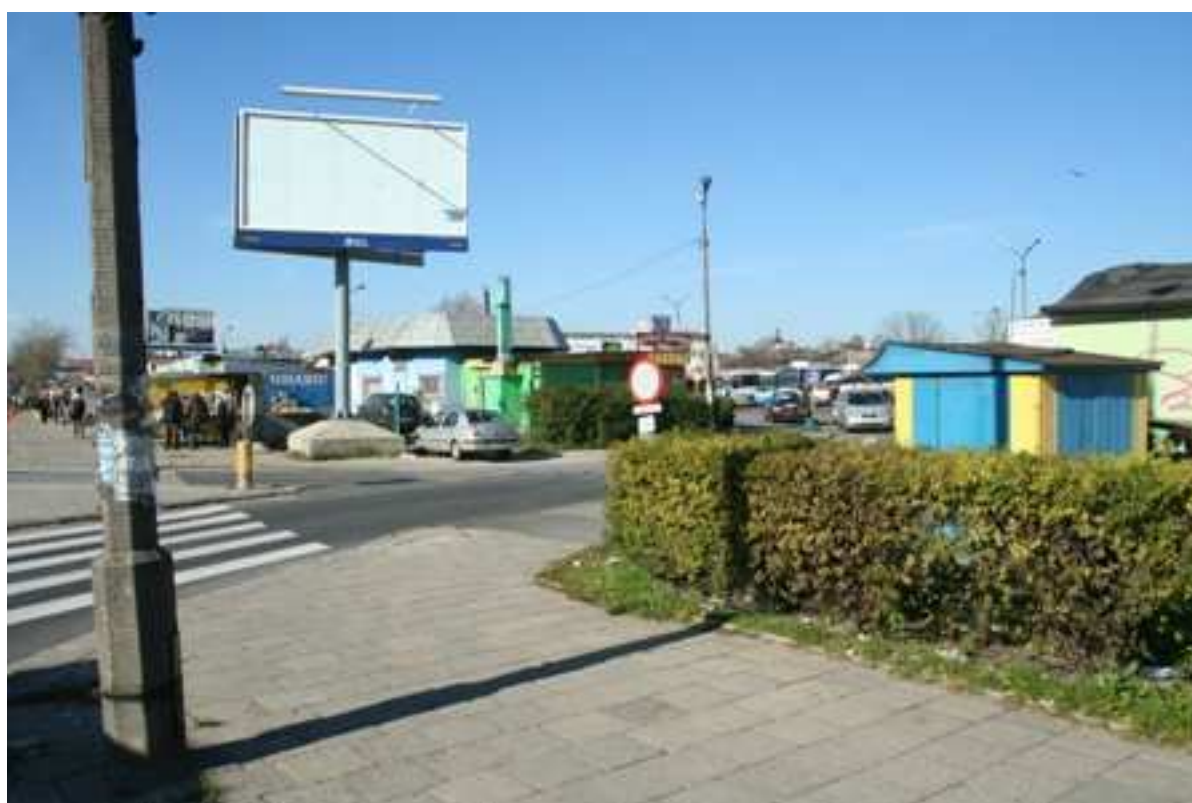
Jateczna 24, 2010.