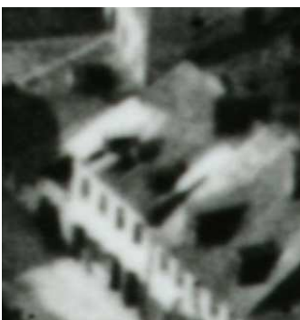
Fragment panoramy Lublina, lata 30., Jateczna 24./A fragment of panorama of Lublin in the 1930s, Jateczna 24,