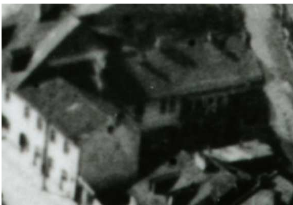
Fragment panoramy Lublina, lata 30., Jateczna 28./A fragment of panorama of Lublin in the 1930s, Jateczna 28,