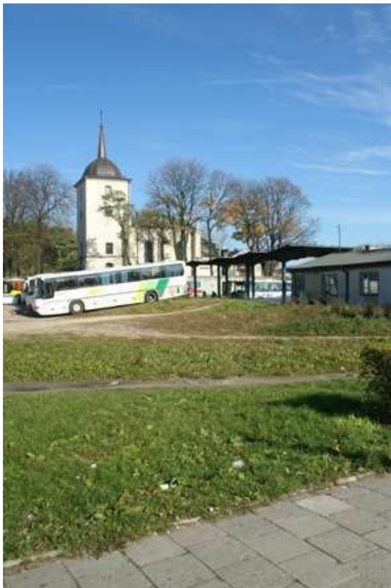
Jateczna 28, 2010.