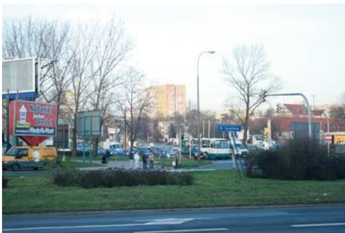
Jateczna 44, fot. Marcin Fedorowicz, 2010.