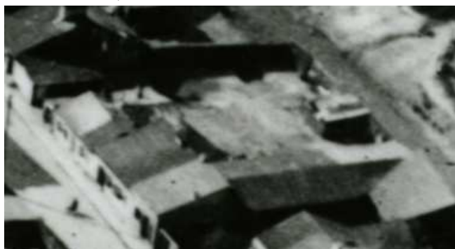
Fragment panoramy Lublina, lata 30., Jateczna 44./A fragment of panorama of Lublin in the 1930s, Jateczna 44,