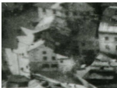
Fragment panoramy Lublina, lata 30., Krawiecka 2/A fragment of panorama of Lublin in the 1930s, Krawiecka 2,