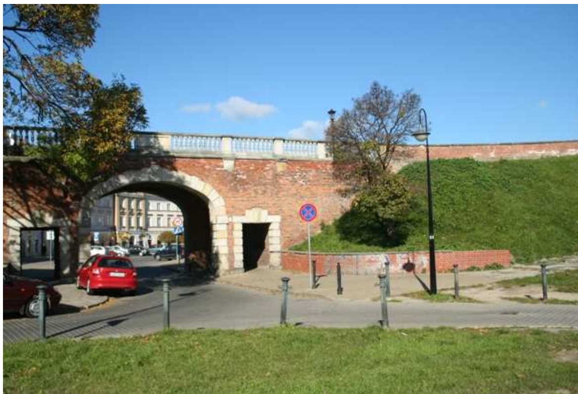
Krawiecka 2, fot. Marcin Fedorowicz, 2010.