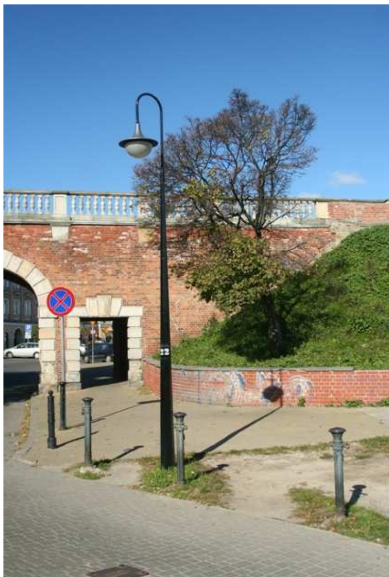
Krawiecka 2, fot. Marcin Fedorowicz, 2010.