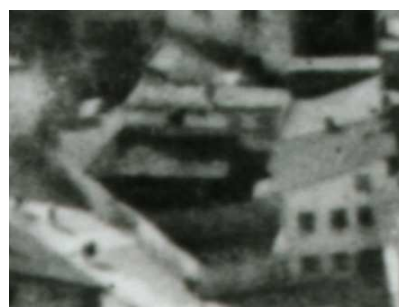
Fragment panoramy Lublina, lata 30., Krawiecka 6/A fragment of panorama of Lublin in the 1930s, Krawiecka 6,