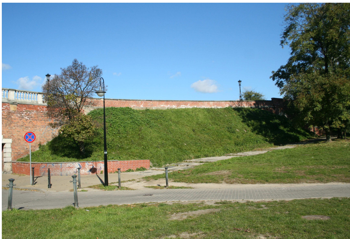
Krawiecka 6, 2010.