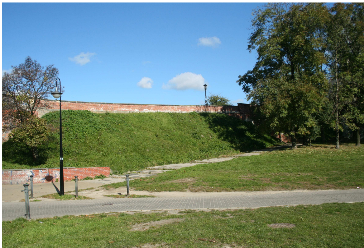
Krawiecka 8, fot. Marcin Fedorowicz, 2010.