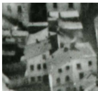
Fragment panoramy Lublina, lata 30., Krawiecka 8/A fragment of panorama of Lublin in the 1930s, Krawiecka 8,