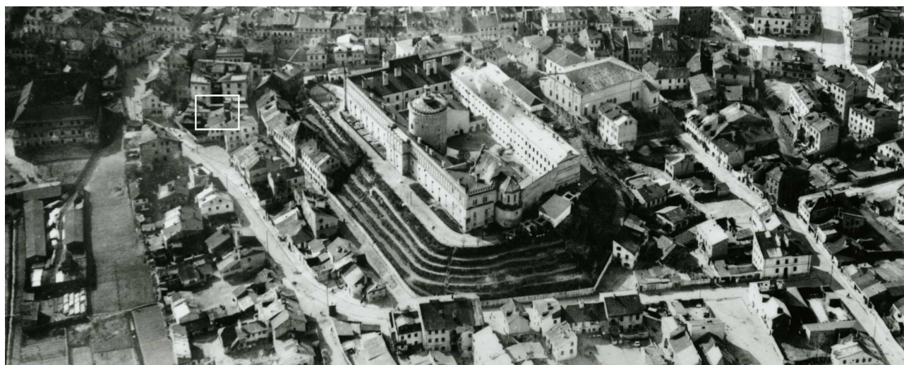
Fragment panoramy Lublina, lata 30., ul. Krawiecka/A fragment of panorama of Lublin in the 1930s, Krawiecka street,