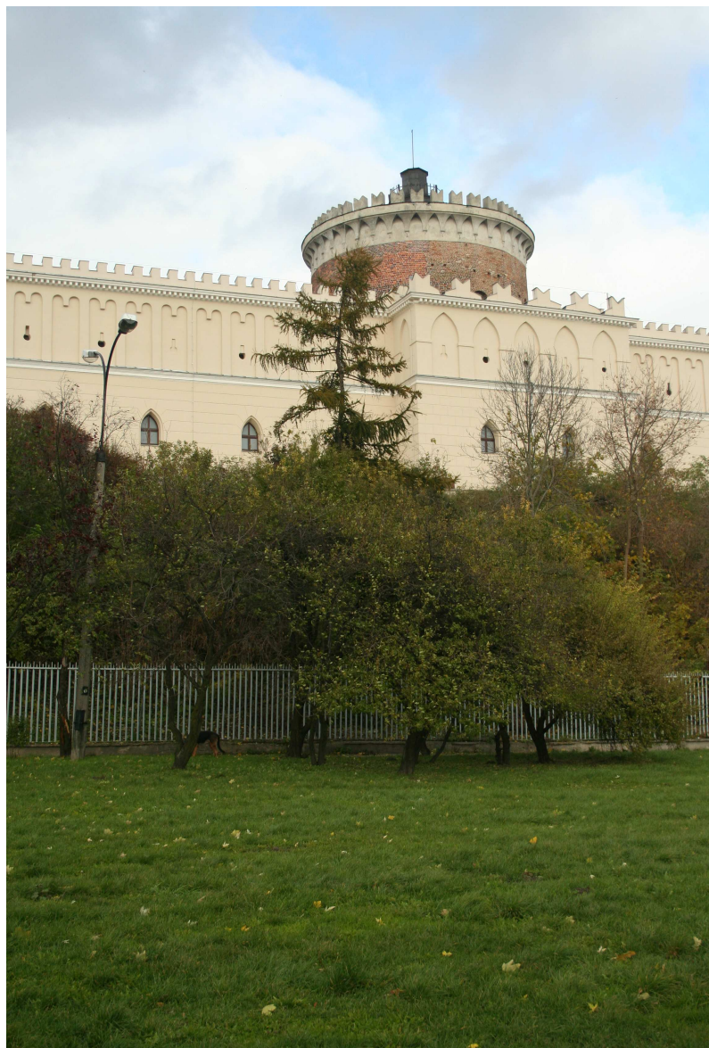
Krawiecka 16, fot. Marcin Fedorowicz, 2010.