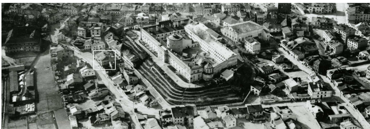
Fragment panoramy Lublina, lata 30., ul. Krawiecka/A fragment of panorama of Lublin in the 1930s, Krawiecka street,