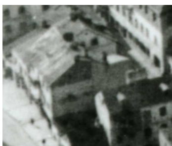
Fragment panoramy Lublina, lata 30., Krawiecka 16/A fragment of panorama of Lublin in the 1930s, Krawiecka 16,