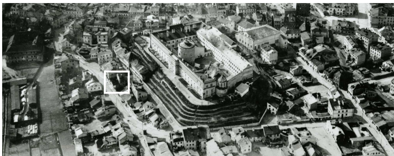
Fragment panoramy Lublina, lata 30., ul. Krawiecka/A fragment of panorama of Lublin in the 1930s, Krawiecka street,