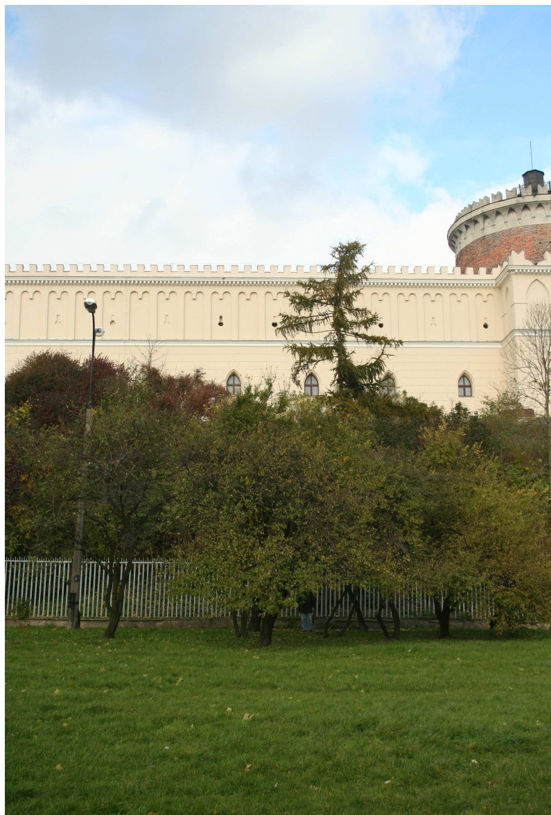
Krawiecka 18, fot. Marcin Fedorowicz, 2010.