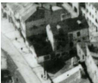
Fragment panoramy Lublina, lata 30., Krawiecka 18/A fragment of panorama of Lublin in the 1930s, Krawiecka 18,