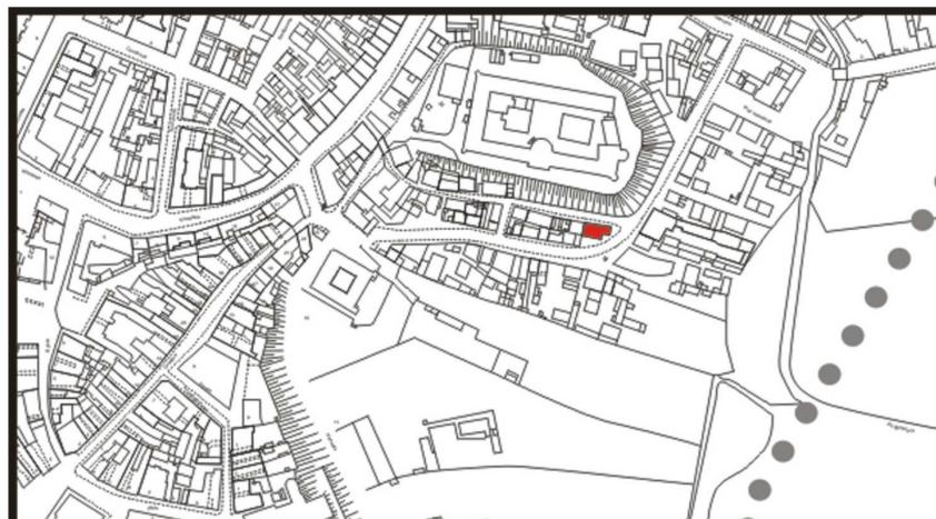
LOKALIZACJA NIERUCHOMOŚCI - Krawiecka 28 LOCATION OF THE PROPERTY - Krawiecka 28