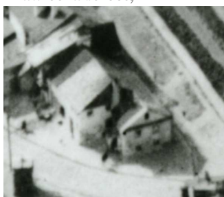
Fragment panoramy Lublina, lata 30., Krawiecka 28/A fragment of panorama of Lublin in the 1930s, Krawiecka 28,