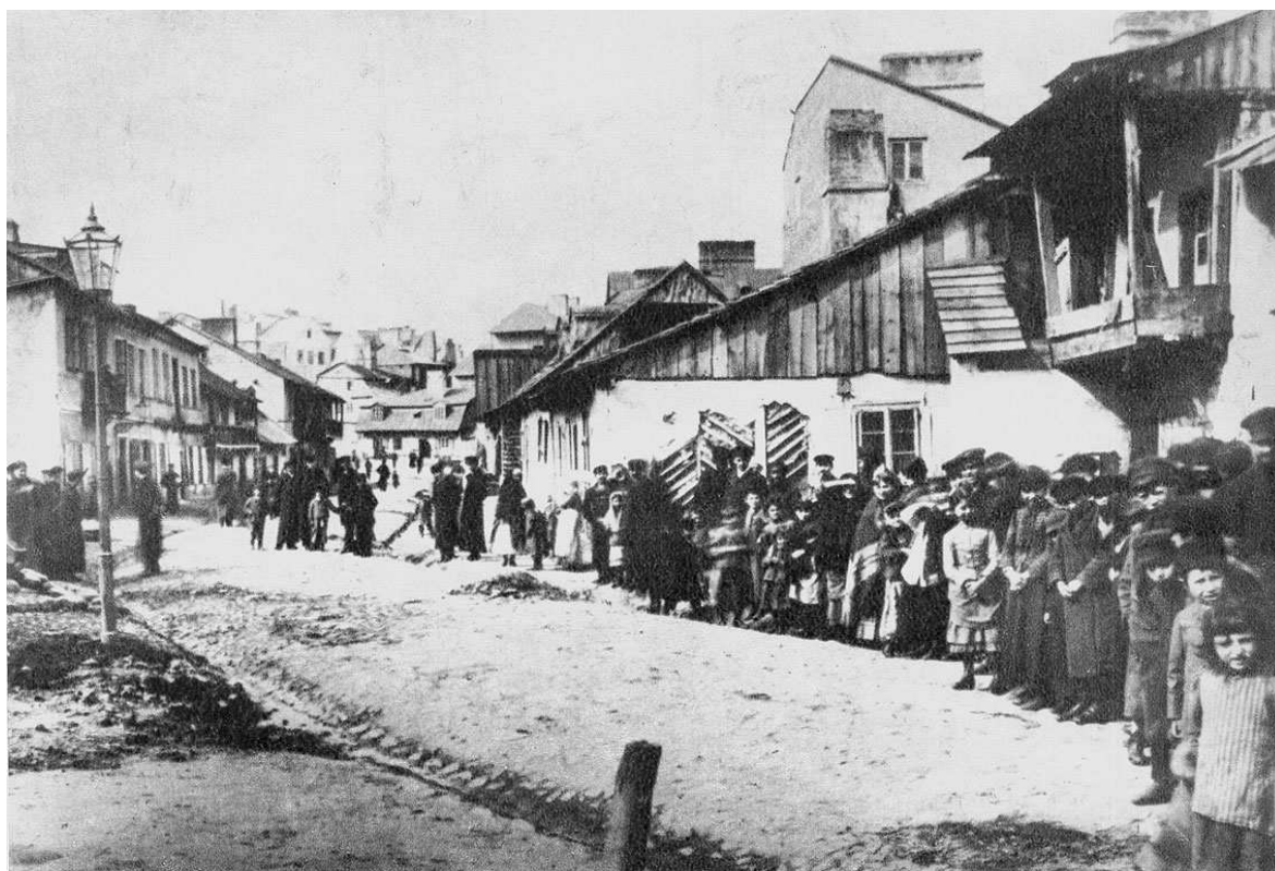
Krawiecka 28, nieruchomość pierwsza od prawej, autor nieznany, początek XX wieku, Archiwum WUOZ w Lublinie.