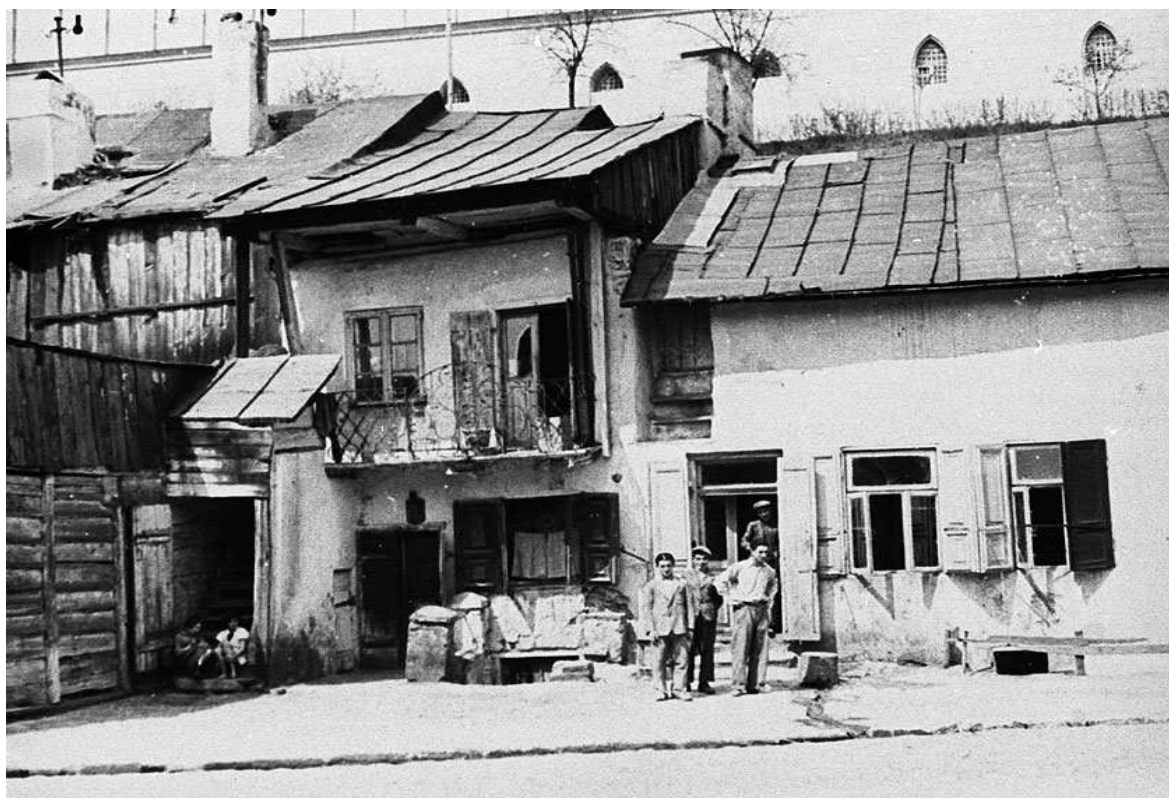
Krawiecka 28, autor nieznan, przed 1939.