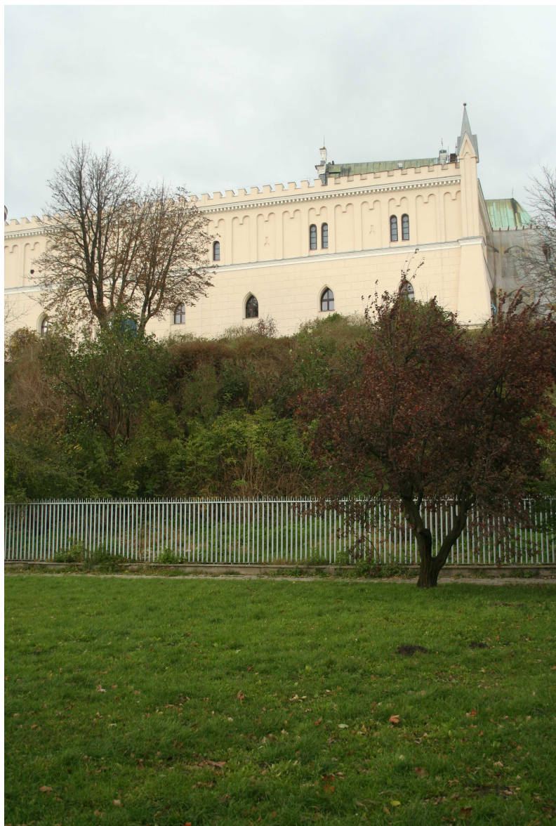
Krawiecka 28, fot. Marcin Fedorowicz, 2010.