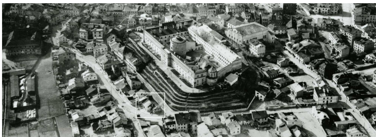
Fragment panoramy Lublina, lata 30., ul. Krawiecka/A fragment of panorama of Lublin in the 1930s,