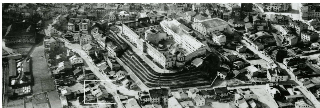
Fragment panoramy Lublina, lata 30., ul. Krawiecka/A fragment of panorama of Lublin in the 1930s, Krawiecka street,