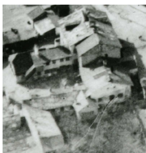
Fragment panoramy Lublina, lata 30., Krawiecka 31/A fragment of panorama of Lublin in the 1930s, Krawiecka 31,