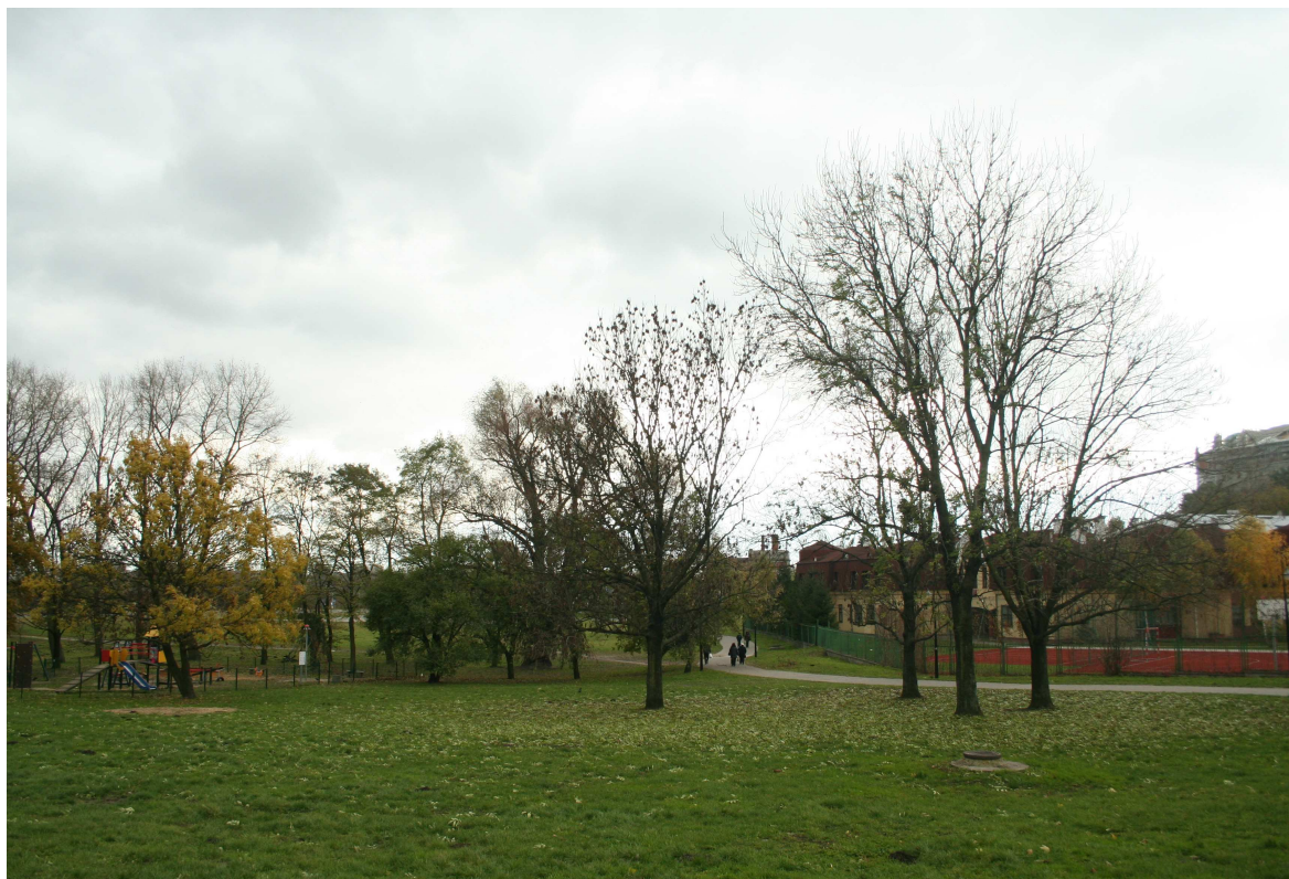
Krawiecka 31, fot. Marcin Fedorowicz, 2010.