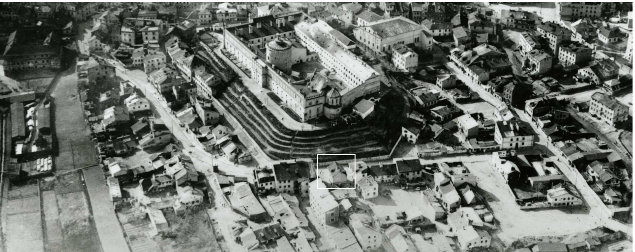
Fragment panoramy Lublina, lata 30., ul. Krawiecka/A fragment of panorama of Lublin in the 1930s, Krawiecka street,