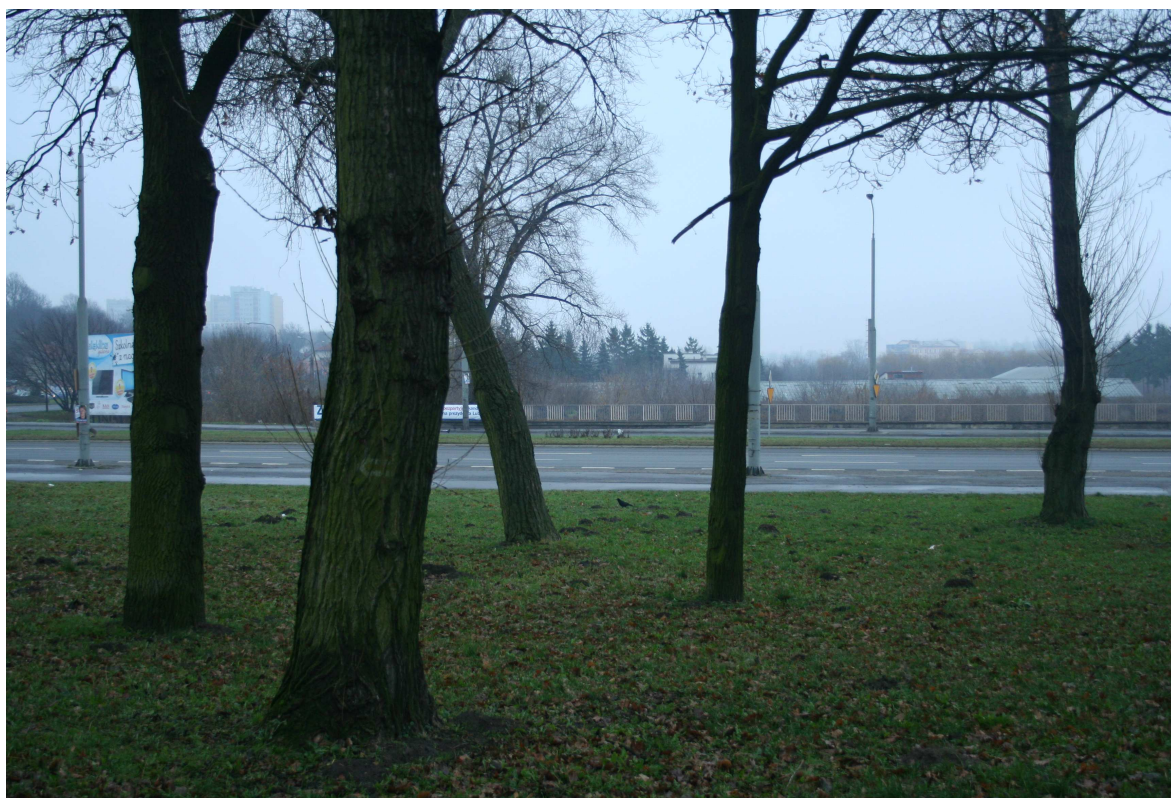
Krawiecka 45, fot. Marcin Fedorowicz, 2010.