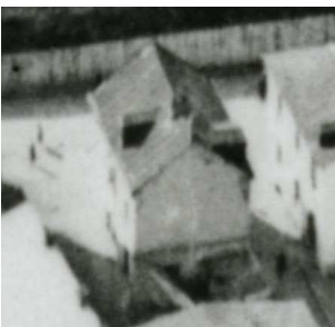
Fragment panoramy Lublina, lata 30., Krawiecka 45/Wąska 1/A fragment of panorama of Lublin in the 1930s, Krawiecka 45/Wąska 1,