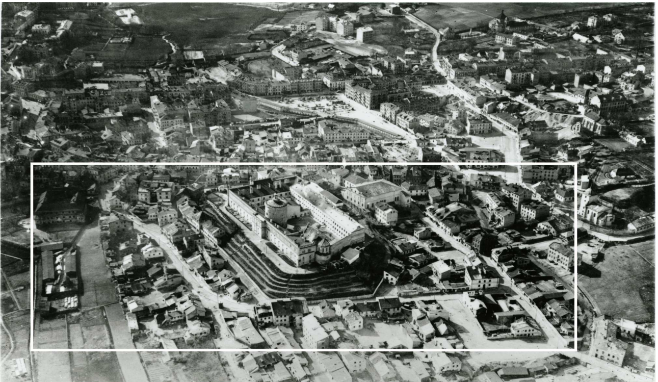
Panorama Lublina, lata 30./Panorama of Lublin in the 1930s,