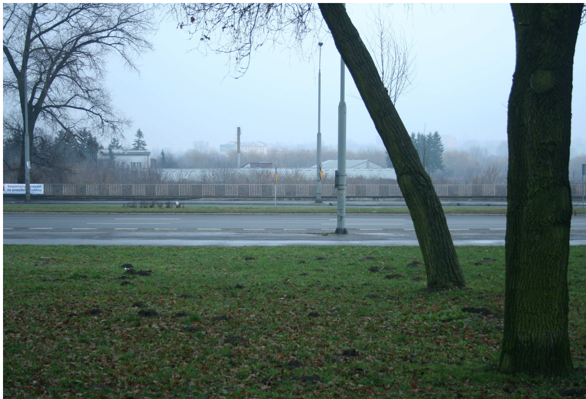
Krawiecka 47, fot. Marcin Fedorowicz, 2010.