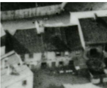
Fragment panoramy lublina, lata 30., Krawiecka 47a/A fragment of panorama of Lublin in the 1930s, Krawiecka 47a