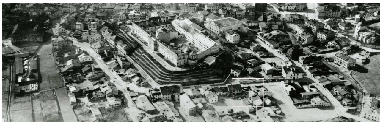
Fragment panoramy Lublina, lata 30., ul. Krawiecka/A fragment of panorama of Lublin in the 1930s, Krawiecka street,