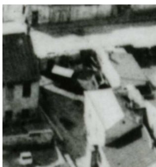
Fragment panoramy Lublina, lata 30., Krawiecka 51/A fragment of panorama of Lublin in the 1930s, Krawiecka 51,