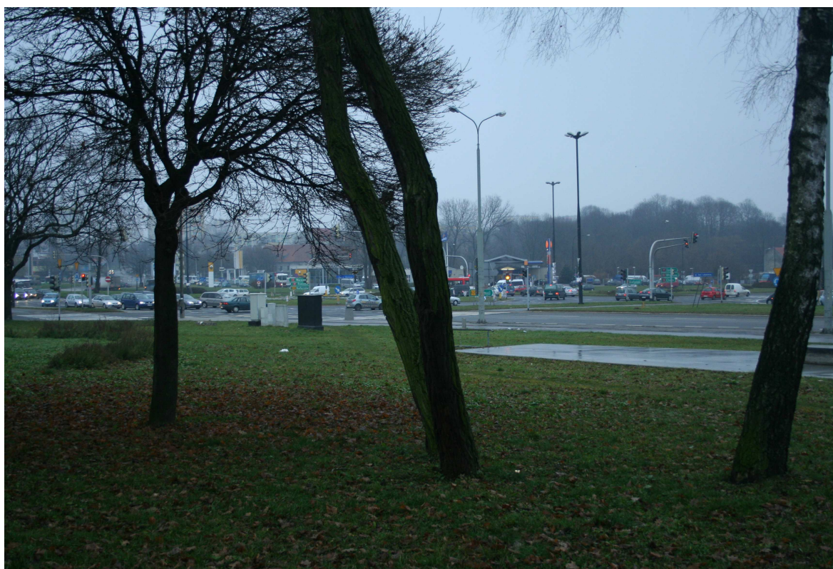
Krawiecka 51, fot. Marcin Fedorowicz, 2010.