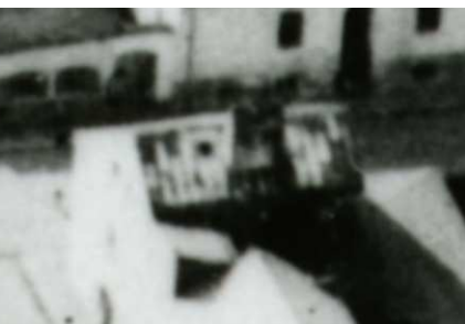
Fragment panoramy Lublina, lata 30., Krawiecka 55/A fragment of panorama of Lublin in the 1930s, Krawiecka 55,