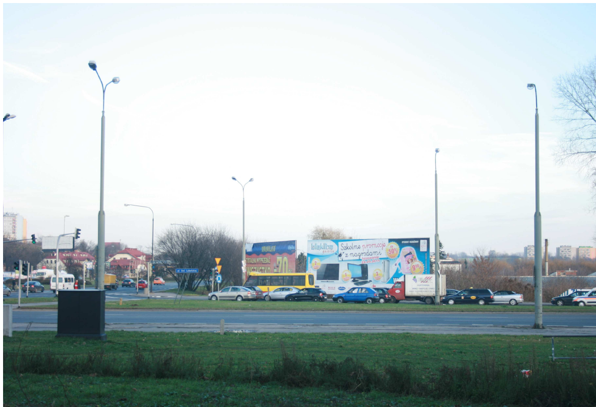
Krawiecka 55, fot. Marcin Fedorowicz, 2010.