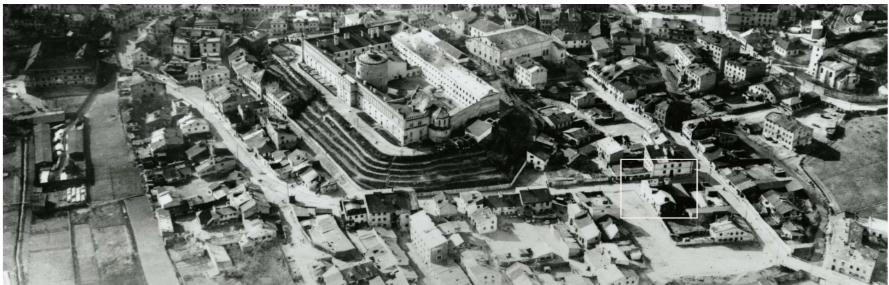
Fragment panoramy Lublina, lata 30., ul. Krawiecka/A fragment of panorama of Lublin in the 1930s, Krawiecka street,