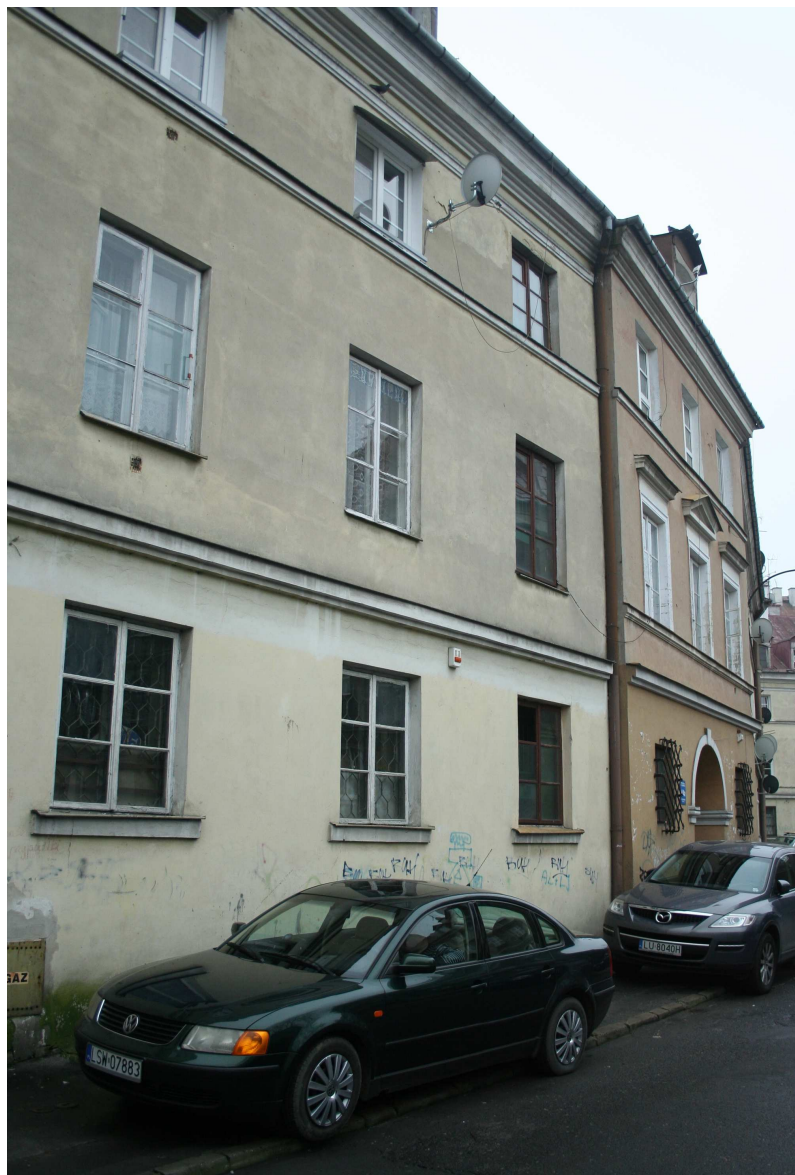
Nadstawna 1/Cyrulicza18, fot. Marcin Fedorowicz, 2010.