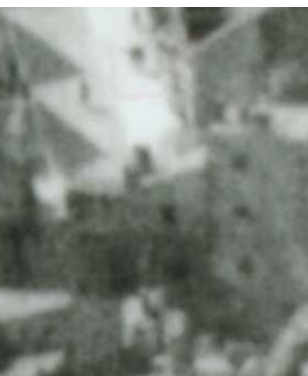
Fragment panoramy Lublina, lata 30., Nadstawna 1/Cyruliczna 18/A fragment of panorama of Lublin in the 1930s, Nadstawna 1/Cyruliczna 18,