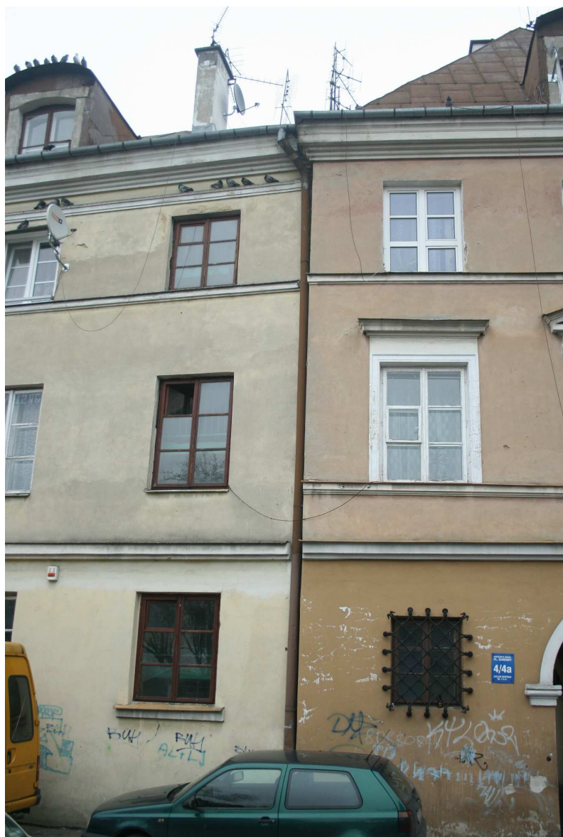
Nadstawna 1/Cyrulicza18, fot. Marcin Fedorowicz, 2010.