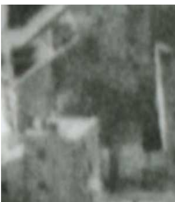
Fragment panoramy Lublina, lata 30., Nadstawna 2/Cyruliczna 16/A fragment of panorama of Lublin in the 1930s, Nadstawna 2/Cyruliczna 16,