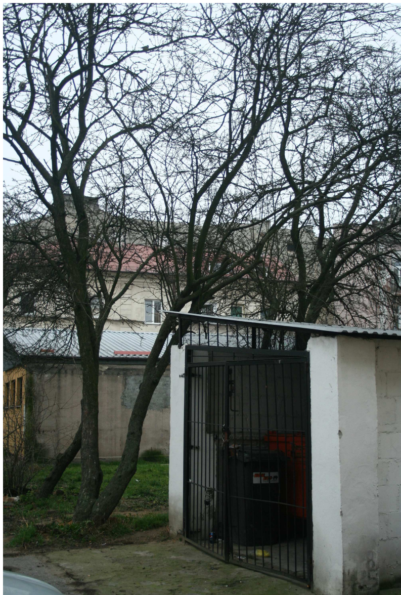
Nastawna 2/Cyrulicza 16, fot. Marcin Fedorowicz, 2010.