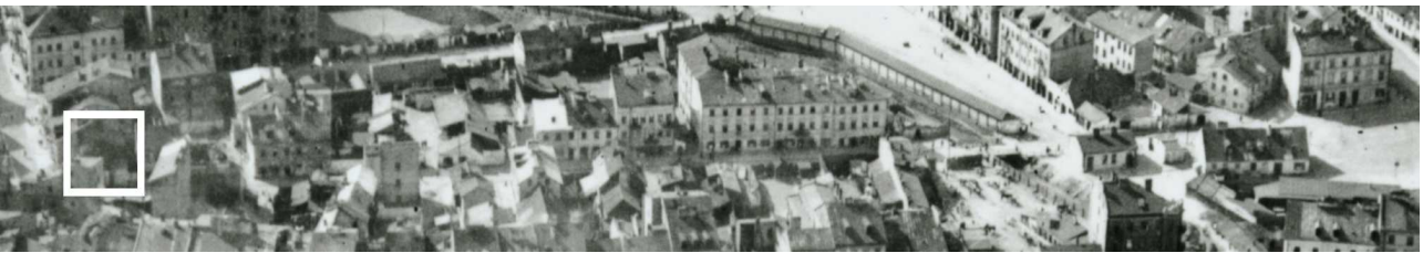
Fragment panoramy Lublina, lata 30., ul. Nadstawna/A fragment of panorama of Lublin in the 1930s, Nadstawna street,