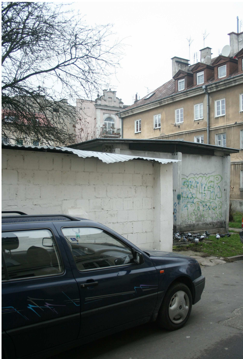
Nastawna 4, fot. Marcin Fedorowicz, 2010.