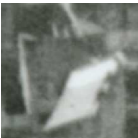
Fragment panoramy Lublina, lata 30., Nadstawna 4/A fragment of panorama of Lublin in the 1930s, Nadstawna 4,