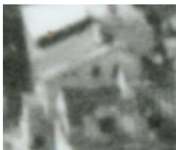
Fragment panoramy Lublina, lata 30., Nadstawna 8/ A fragment of panorama of Lublin in the 1930s, Nadstawna 8,