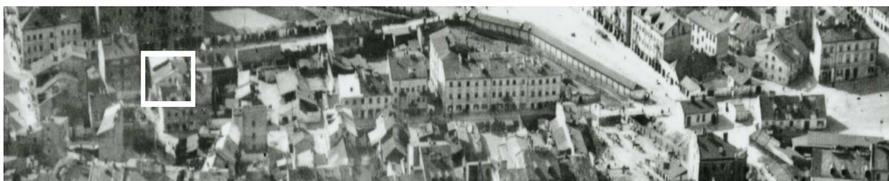
Fragment panoramy Lublina, lata 30., ul. Nadstawna/ A fragment of panorama of Lublin in the 1930s, Nadstawna street,