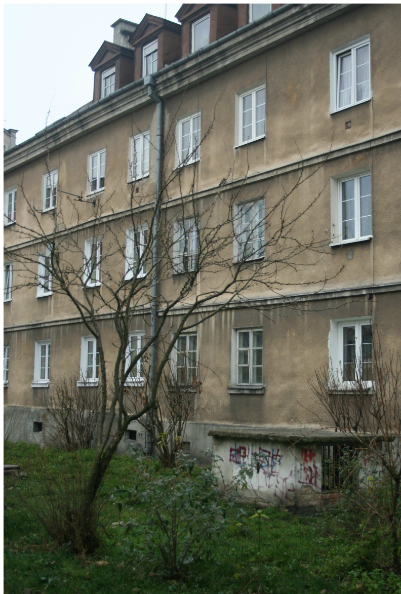
Nastawna 8, fot. Marcin Fedorowicz, 2010.