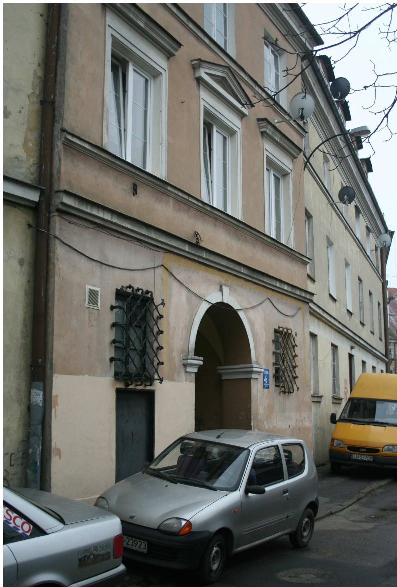
Nastawna 9, 2010.