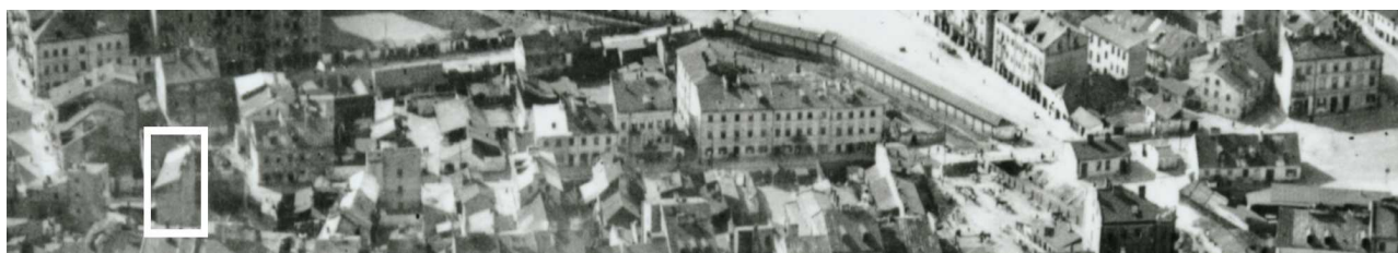
Fragment panoramy Lublina, lata 30., ul. Nadstawna/ A fragment of panorama of Lublin in the 1930s, Nadstawna street,