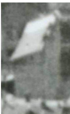
Fragment panoramy Lublina, lata 30., Nadstawna 9/ A fragment of panorama of Lublin in the 1930s, Nadstawna 9,