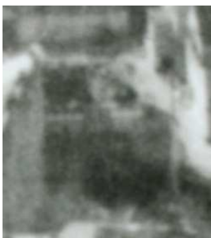
Fragment panoramy Lublina, lata 30., Nadstawna 11/ A fragment of panorama of Lublin in the 1930s, Nadstawna 11,