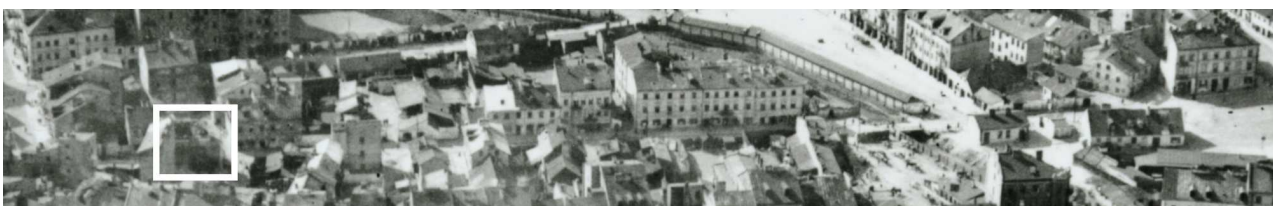
Fragment panoramy Lublina, lata 30., ul. Nadstawna/ A fragment of panorama of Lublin in the 1930s, Nadstawna street,