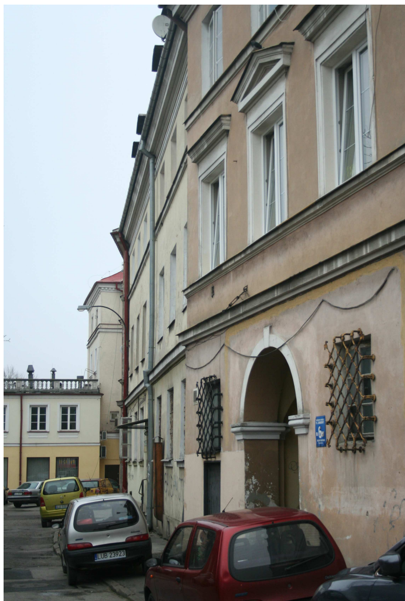
Nastawna 11, fot. Marcin Fedorowicz, 2010.