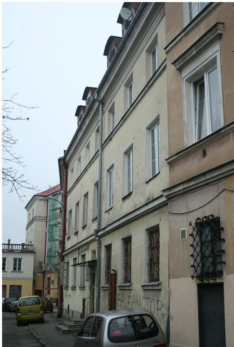
Nastawna 13, fot. Marcin Fedorowicz, 2010.