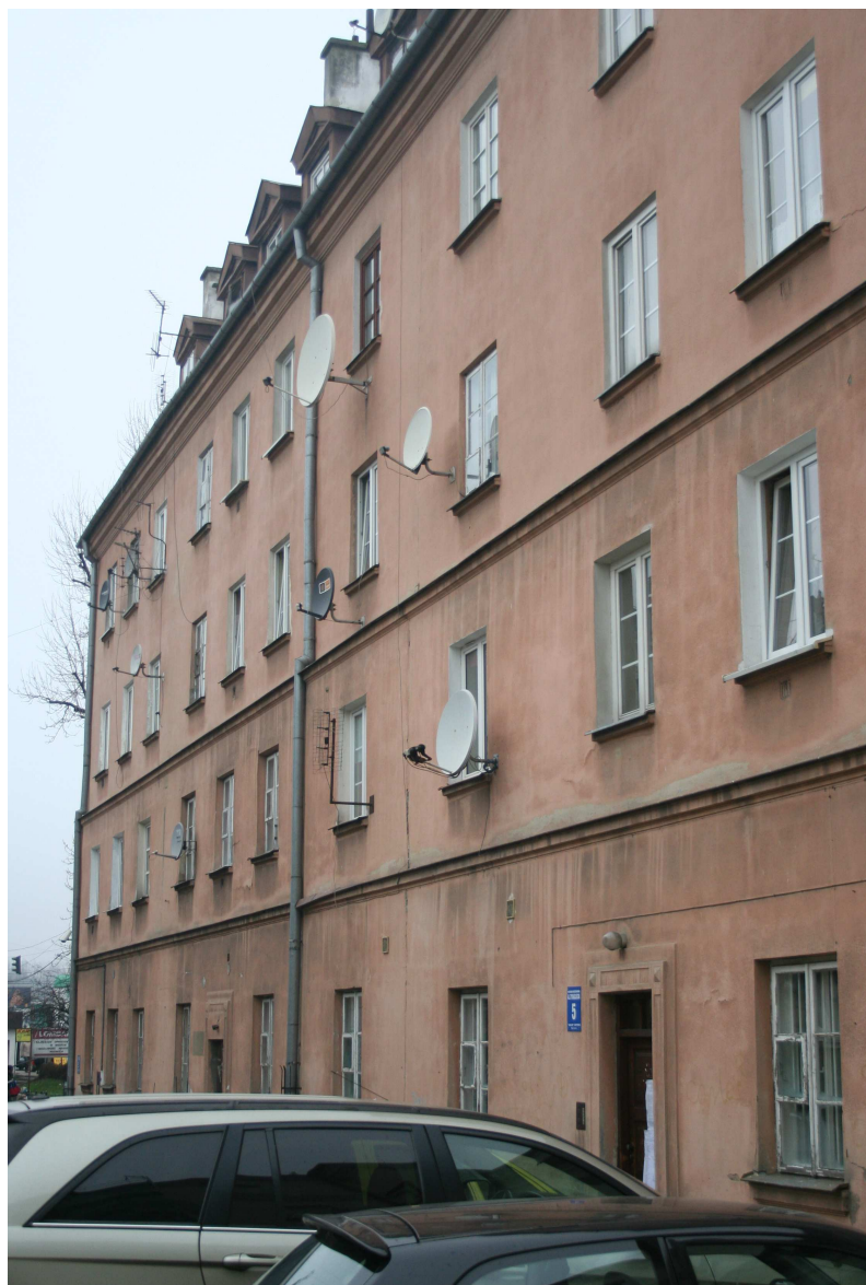
Nastawna 16, fot. Marcin Fedorowicz, 2010.