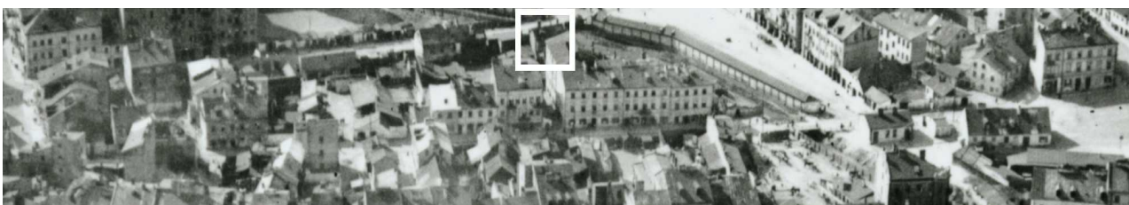
Fragment panoramy Lublina, lata 30., ul. Nadstawna/ A fragment of panorama of Lublin in the 1930s, Nadstawna street,