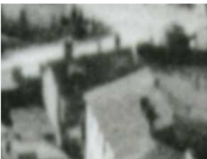
Fragment panoramy Lublina, lata 30., Nadstawna 18/ A fragment of panorama of Lublin in the 1930s, Nadstawna 18,