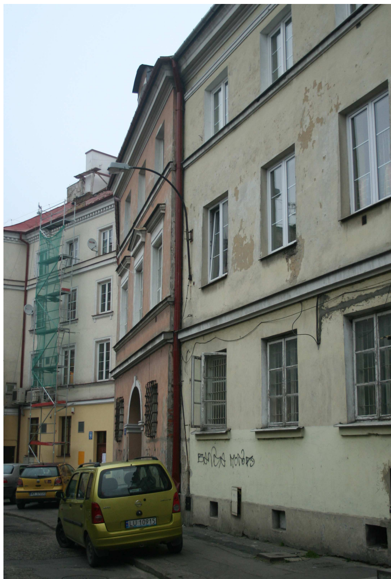
Nastawna 19, 2010.