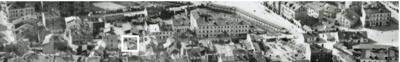
Fragment panoramy Lublina, lata 30., ul. Nadstawna/ A fragment of panorama of Lublin in the 1930s,