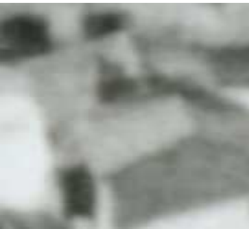
Nadstawna street, Fragment panoramy Lublina, lata 30., Nadstawna 19/ A fragment of panorama of Lublin in the 1930s, Nadstawna 19,