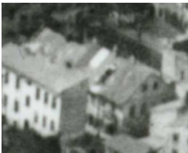
Fragment panoramy Lublina, lata 30., Nadstawna 24/ A fragment of panorama of Lublin in the 1930s, Nadstawna 24,