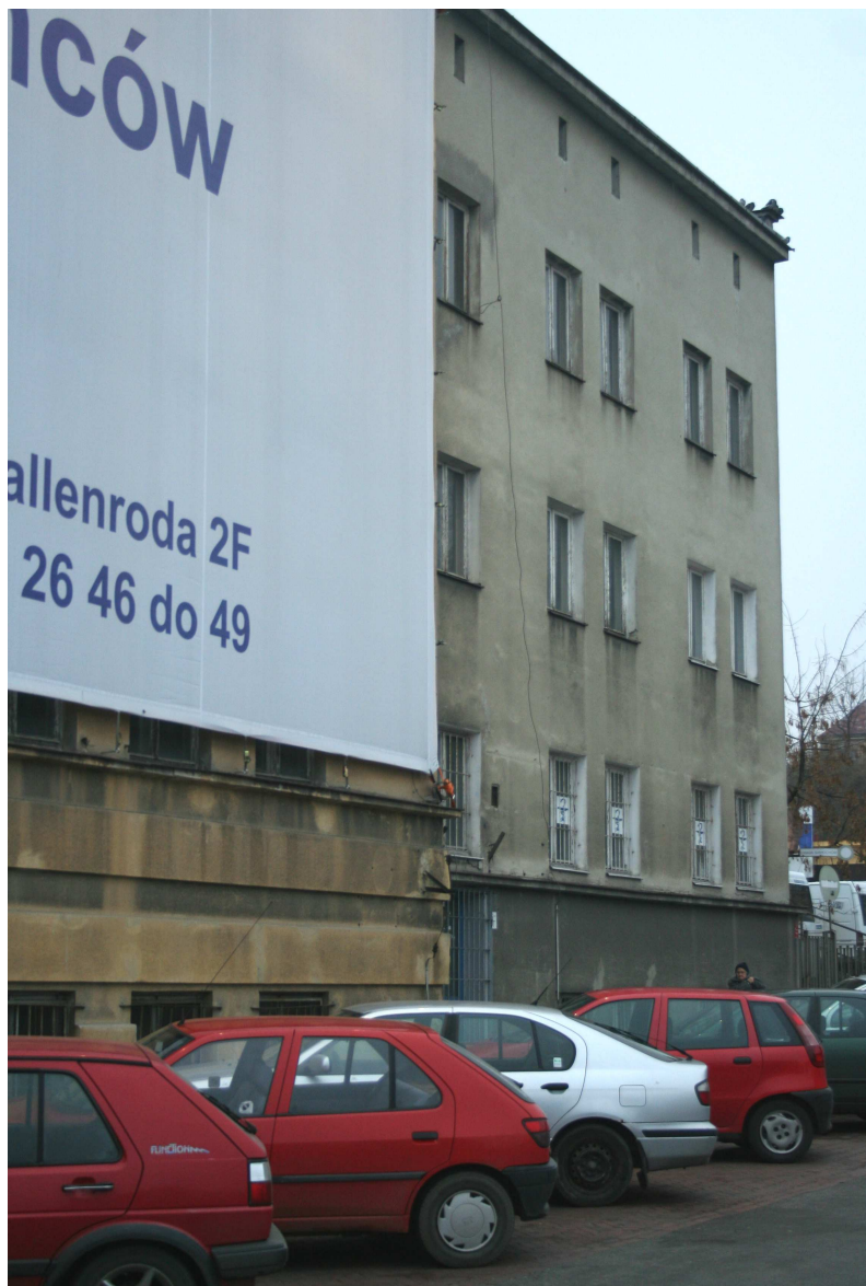
Nastawna 24, fot. Marcin Fedorowicz, 2010.