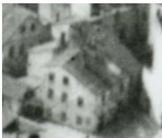
Fragment panoramy Lublina, lata 30., Nadstawna 28/A fragment of panorama of Lublin in the 1930s, Nadstawna 28,