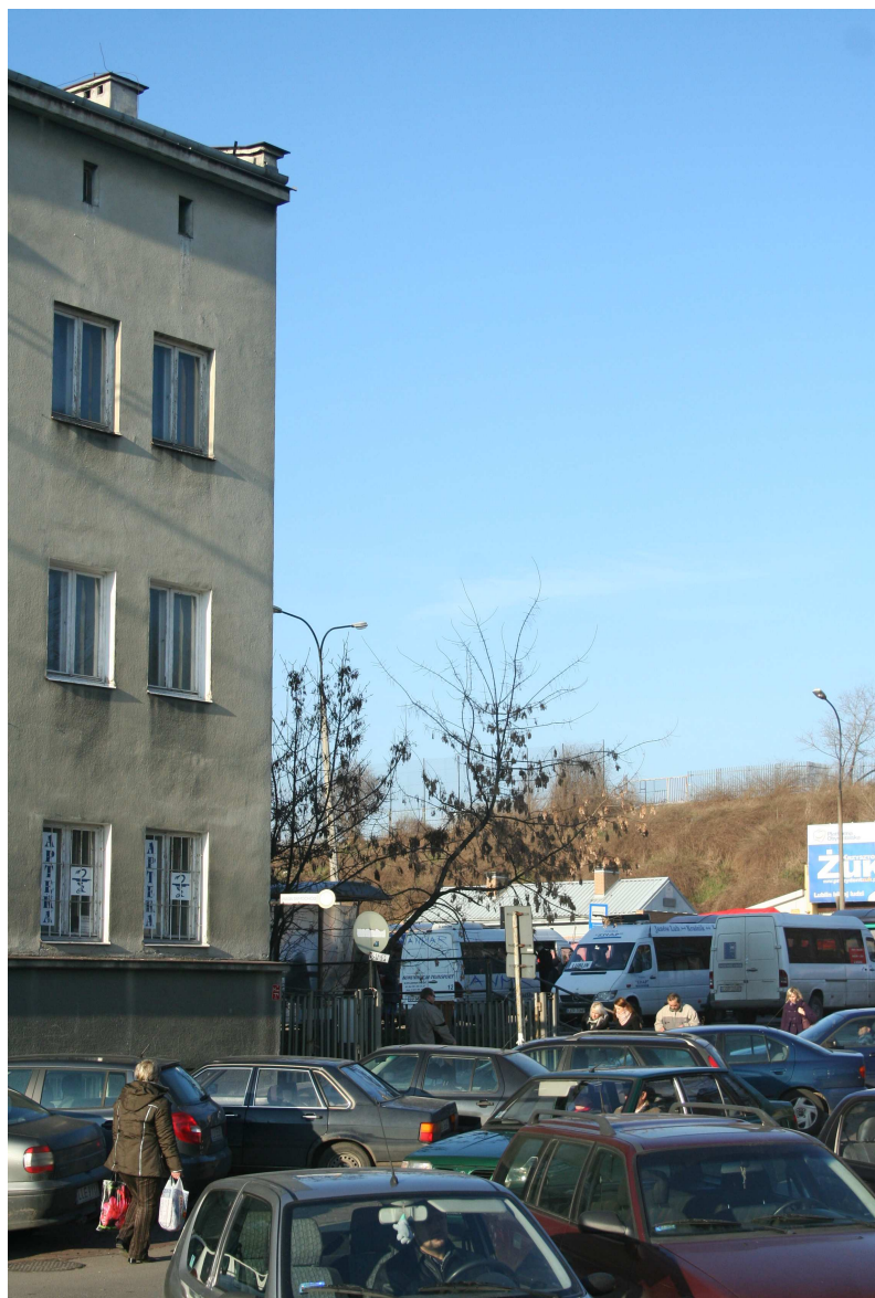
Nastawna 28, fot. Marcin Fedorowicz, 2010.