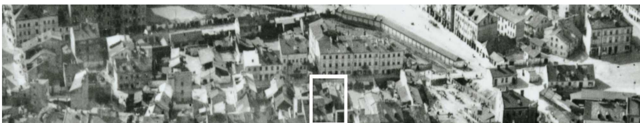
Fragment panoramy Lublina, lata 30., ul. Nadstawna/ A fragment of panorama of Lublin in the 1930s, Nadstawna street,