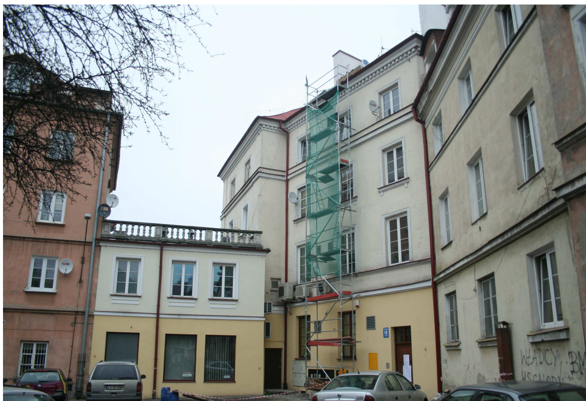
Nastawna 29, fot. Marcin Fedorowicz, 2010.