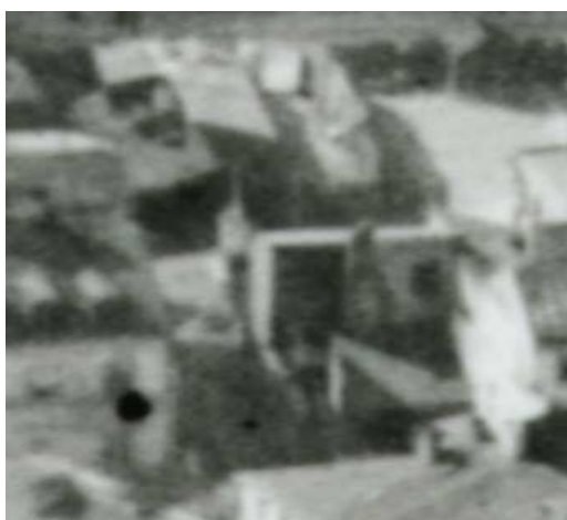
Fragment panoramy Lublina, lata 30., Nadstawna 29/ A fragment of panorama of Lublin in the 1930s, Nadstawna 29,