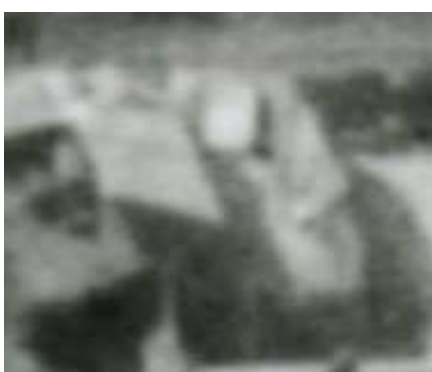
Fragment panoramy Lublina, lata 30., Nadstawna 31/ A fragment of panorama of Lublin in the 1930s, Nadstawna 31,