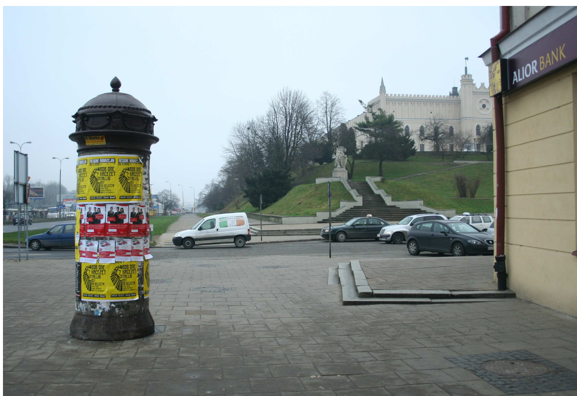
Nastawna 31, fot. Marcin Fedorowicz, 2010.