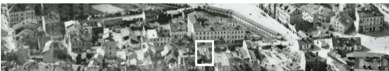
Fragment panoramy Lublina, lata 30., ul. Nadstawna/ A fragment of panorama of Lublin in the 1930s, Nadstawna street,