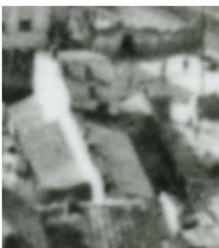
Fragment panoramy Lublina, lata 30., Nadstawna 37/A fragment of panorama of Lublin in the 1930s, Nadstawna 37,