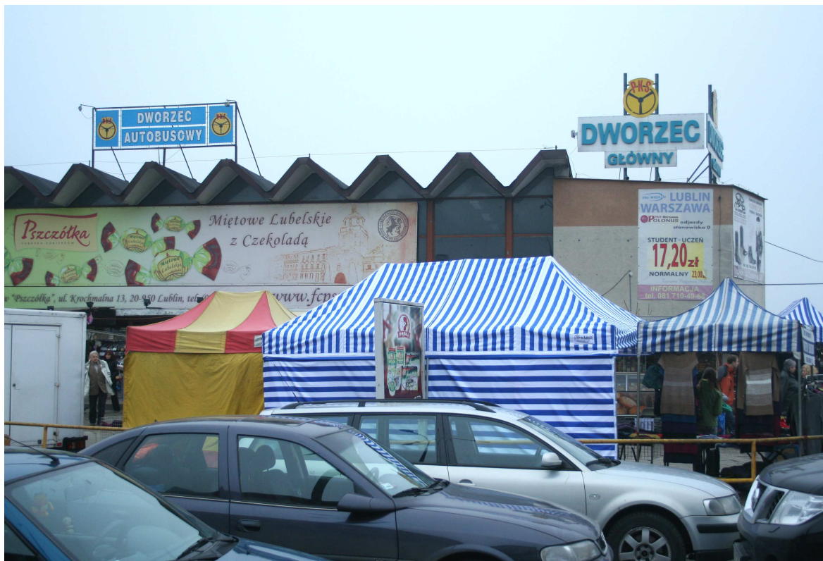
Nadstawną 37, fot. Marcin Fedorowicz, 2010.