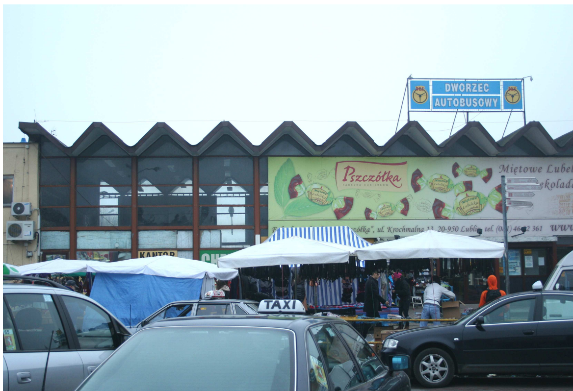
Nastawna 39, 2010.