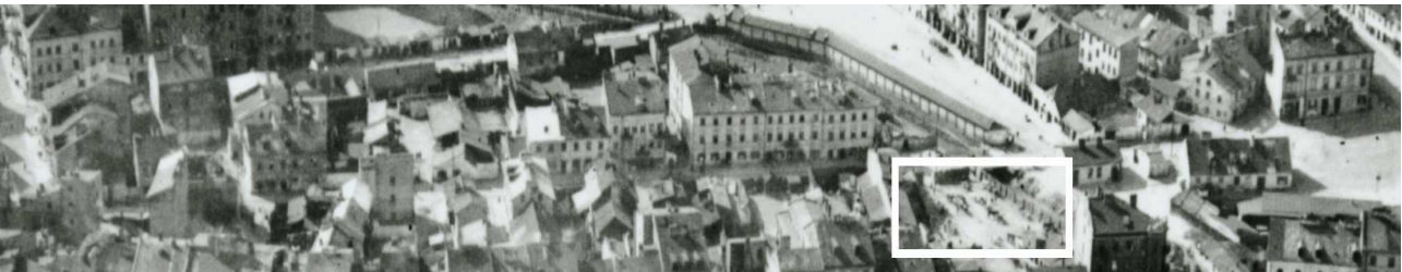
Fragment panoramy Lublina, lata 30., ul. Nadstawna/ A fragment of panorama of Lublin in the 1930s, Nadstawna street,