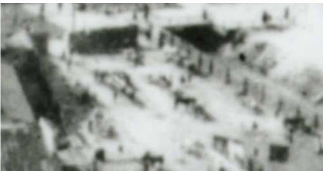
Fragment panoramy Lublina, lata 30., Nadstawna 39(41)/ A fragment of panorama of Lublin in the 1930s, Nadstawna 39(41),