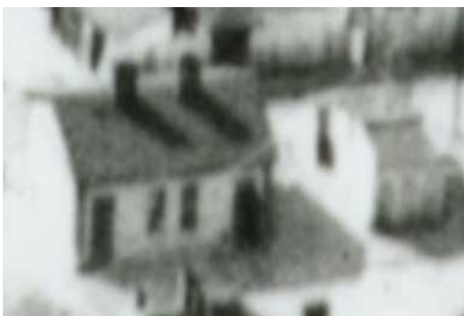
Fragment panoramy Lublina, lata 30., Nadstawna 43/ A fragment of panorama of Lublin in the 1930s, Nadstawna 43,