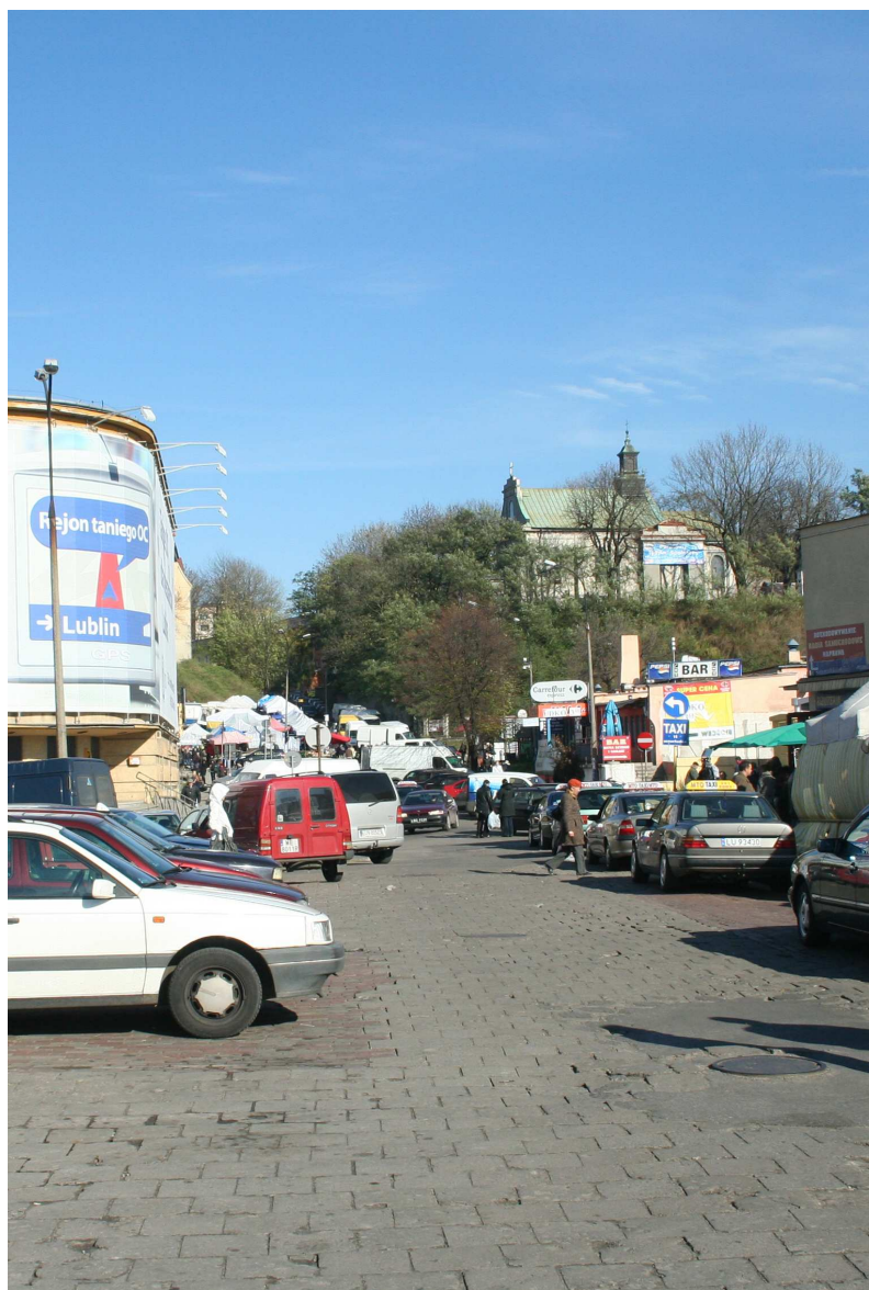
Nastawna 43, 2010.