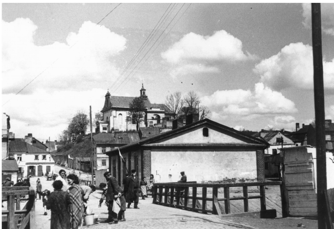
Nadstawna 43, widok z okolic Czechówki, autor prawdopodobnie Wiktor Ziółkowski, przed 1939.