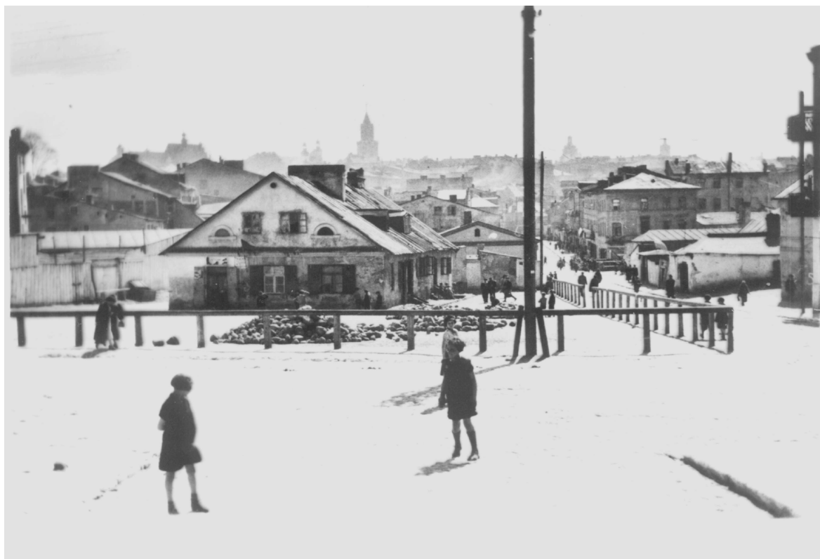
Nadstawna 45, kaszarnia, widok od ulicy Ruskiej, autor Wiktor Ziółkowski, 1930, własność Muzeum Historii Miasta Lublina.