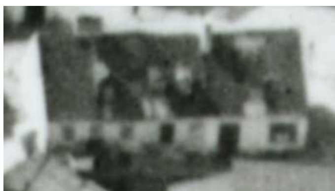
Fragment panoramy Lublina, lata 30., Nadstawna 45/A fragment of panorama of Lublin in the 1930s, Nadstawna 45,