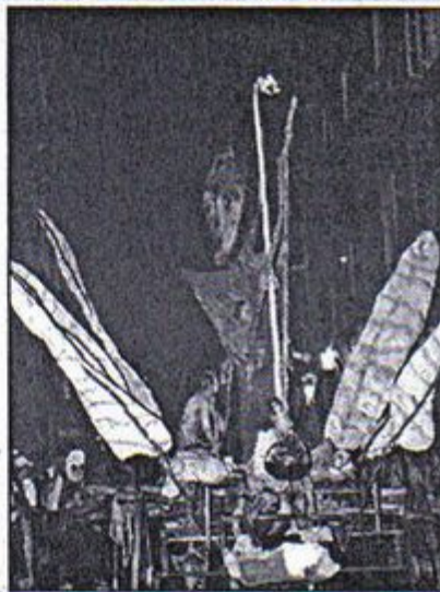
Sobótkę zakończył uliczny spektakl pt. „Kosmosaga naczynia wszechmiłości” w wykonaniu wędrownego teatru Klinika Lalek z Wolimierza w Sudetach.

W muzycznej wieży Babel udział wzięli: Muzykanci z Krakowa, czołowy zespół folkowy z Łotwy Ilgi, Orkiestra Św. Mikołaja i kapela Pół Postu z Lublina, białoruski zespół Dimitri Trojca & Drum XTC, orientalny kwartet Jahiar Group, Viva Flamenco i występujący w szkockich i średniowiecznych strojach zespół Shannon.