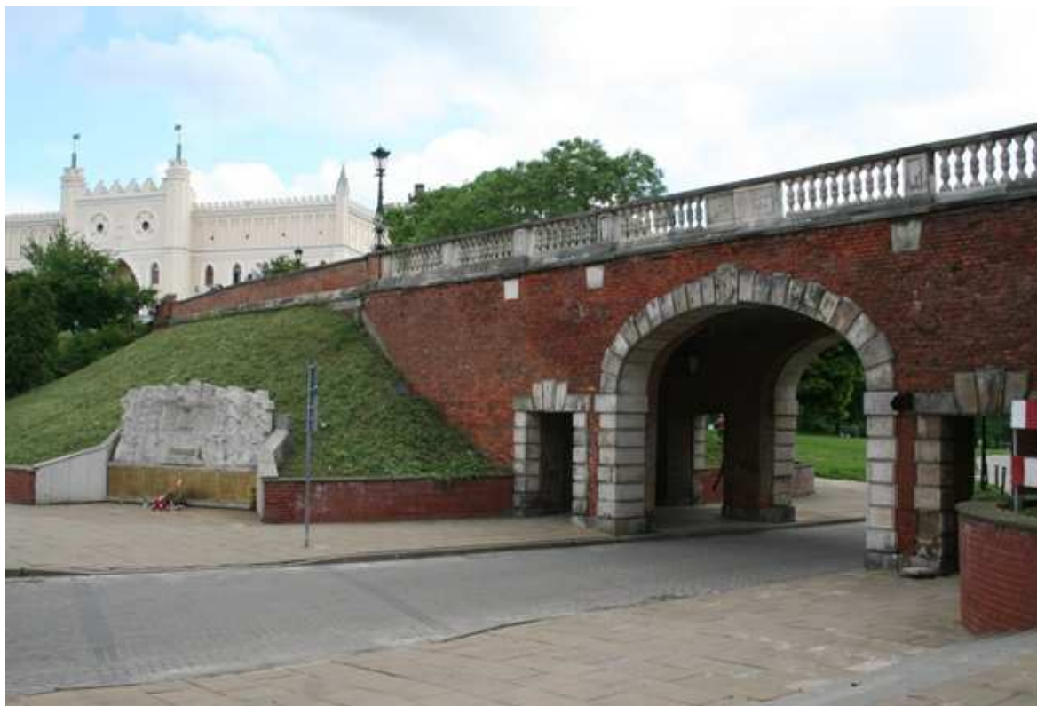
Szeroka 1, fot. Marcin Fedorowicz, 2010.