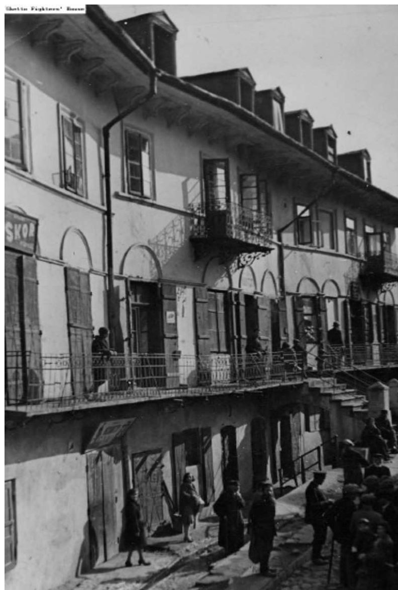
Szeroka 1, autor nieznany, autor nieznany, przed 1939, własność Ghetto Fighter's House.