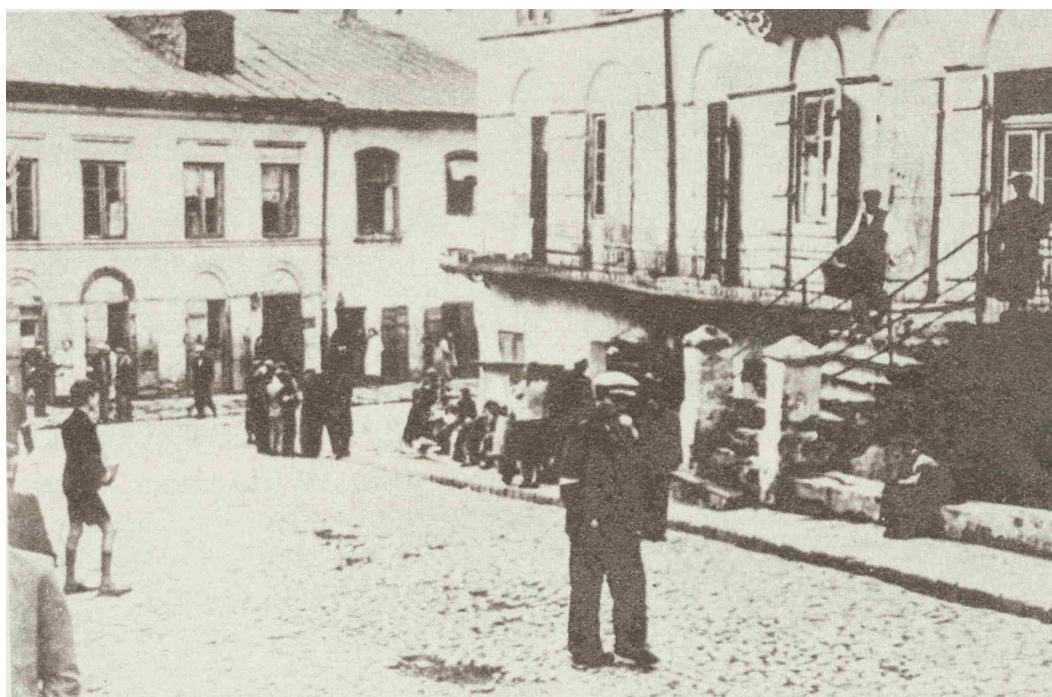
Szeroka 1, getto, autor nieznan, ok. 1941, własność Associated Press.