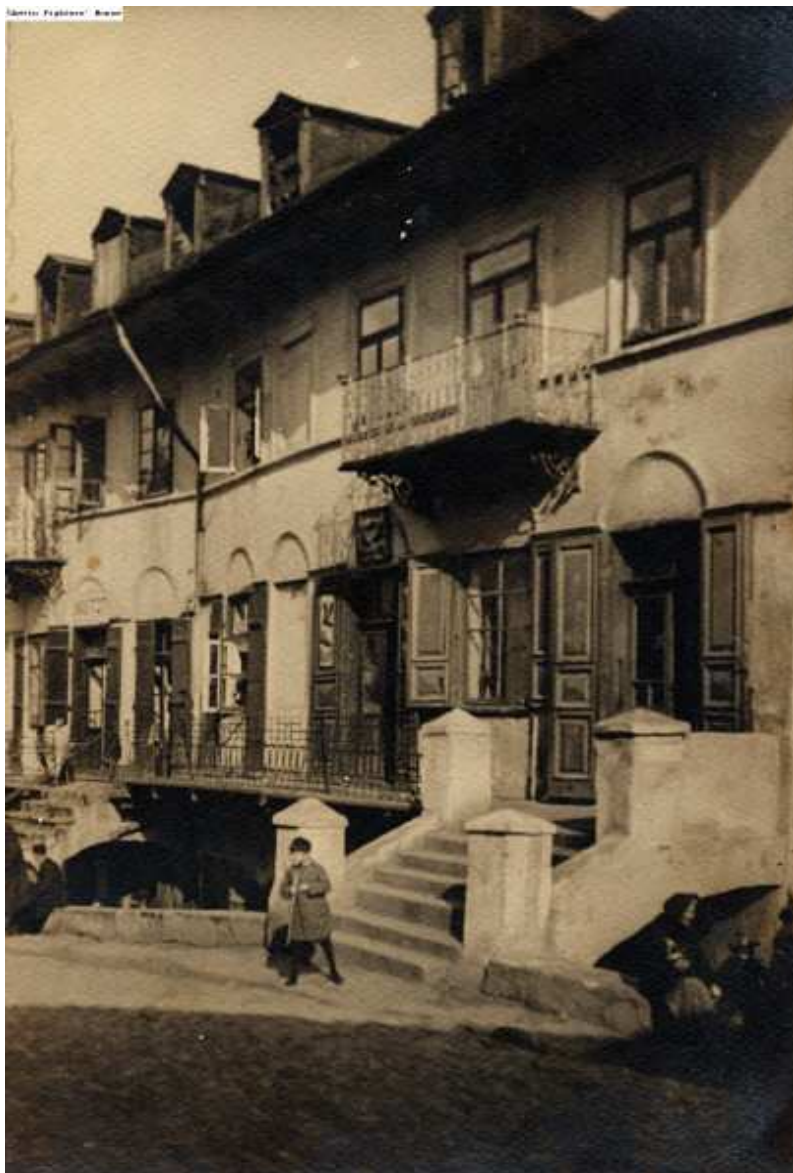
Szeroka 1, autor nieznany, autor nieznany, przed 1939, własność Ghetto Fighter's House.