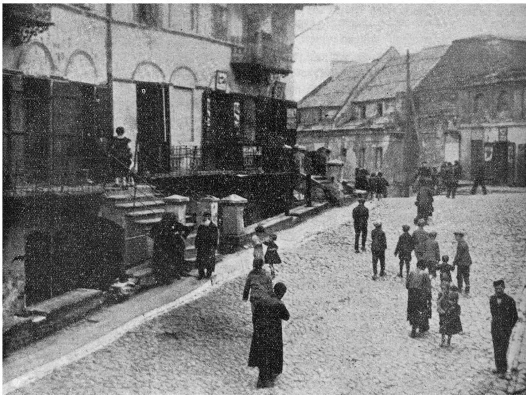
Szeroka 1, tzw. Psia Górka, autor nieznany, przed 1939, kolekcja Symchy Wajsa,