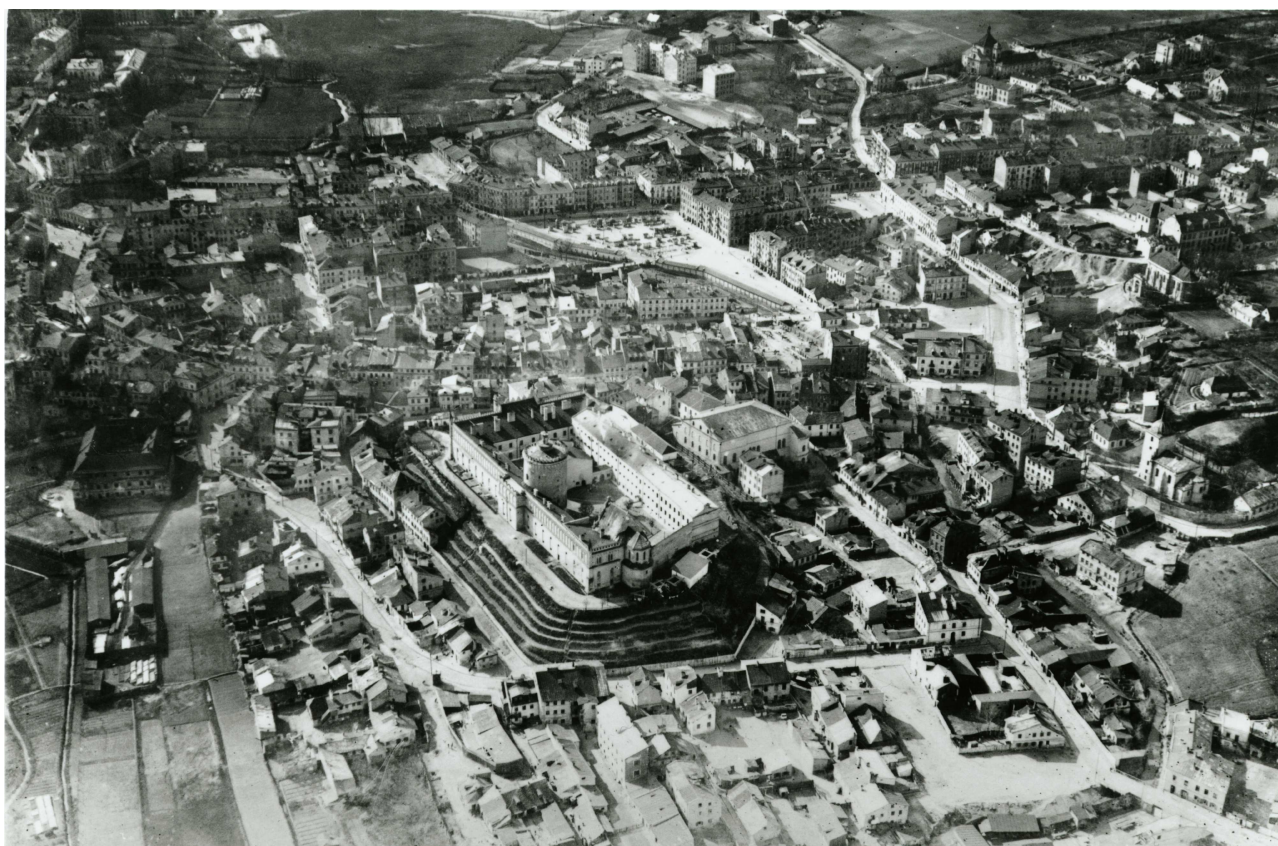
Panorama Lublina, lata 30./Panorama of Lublin in the 1930s,