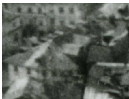
Fragment panoramy Lublina, lata 30., Szeroka 1/A fragment of panorama of Lublin in the 1930s, Szeroka 1,