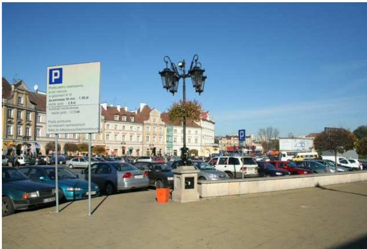
Szeroka 4, fot. Marcin Fedorowicz, 2010.