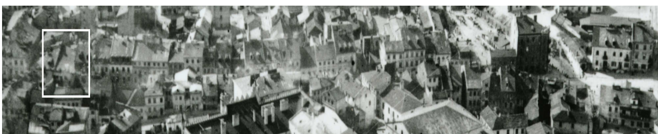
Fragment panoramy Lublina, lata 30., ul. Szeroka/A fragment of panorama of Lublin in the 1930s, Szeroka street,