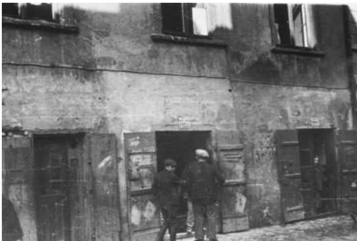
Szeroka 4, autor Stefan Kielsznia, ok. 1938, własność Jerzego Kielszni.