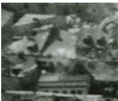
Fragment panoramy Lublina, lata 30., Szeroka 4/A fragment of panorama of Lublin in the 1930s, Szeroka 4,