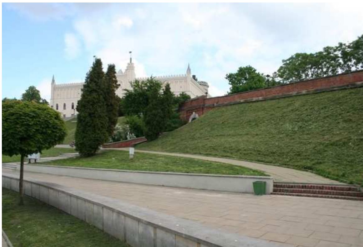
Szeroka 5, fot. Marcin Fedorowicz, 2010.