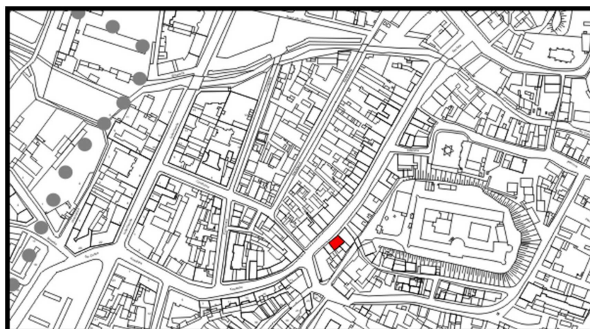
LOKALIZACJA NIERUCHOMOŚCI - Szeroka 5 LOCATION OF THE PROPERTY - Szeroka 5