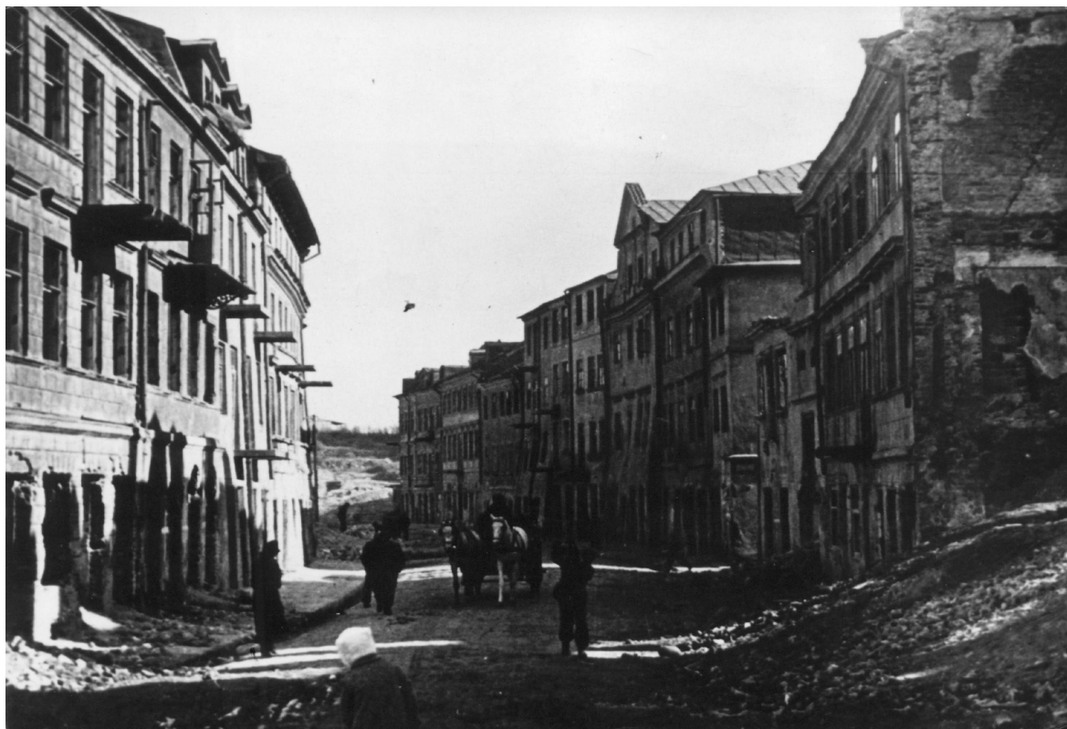
Szeroka 5, nieruchomość druga od prawej, ok 1943.