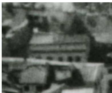
Fragment panoramy Lublina, lata 30., Szeroka 5/A fragment of panorama of Lublin in the 1930s, Szeroka 5,