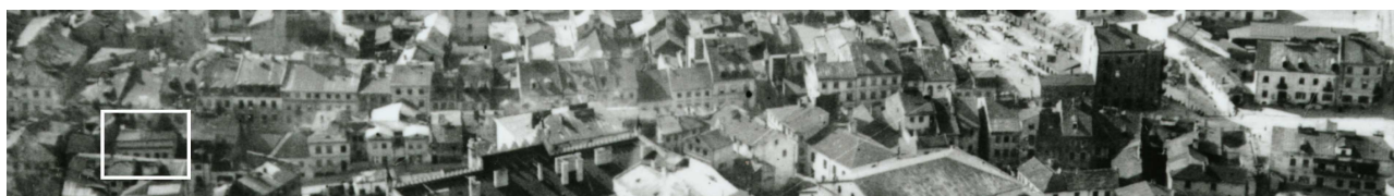
Fragment panoramy Lublina, lata 30., ul. Szeroka/A fragment of panorama of Lublin in the 1930s, Szeroka street,