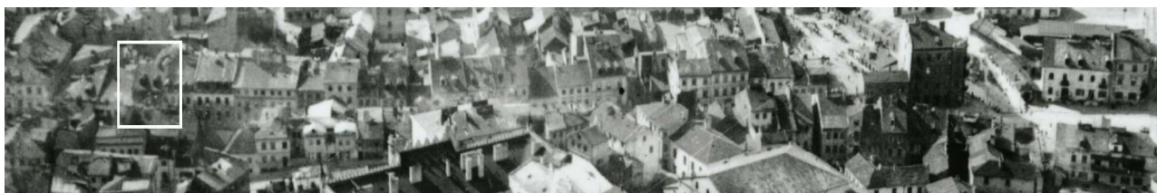
Fragment panoramy Lublina, lata 30., ul. Szeroka/ A fragment of panorama of Lublin in the 1930s, Szeroka street,