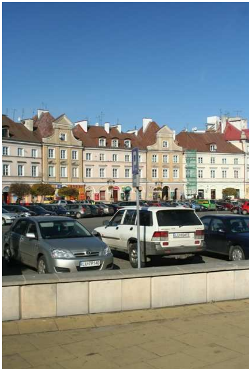
Szeroka 6, fot. Marcin Fedorowicz, 2010.