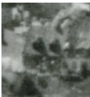
Fragment panoramy Lublina, lata 30., Szeroka 6/ A fragment of panorama of Lublin in the 1930s, Szeroka 6,