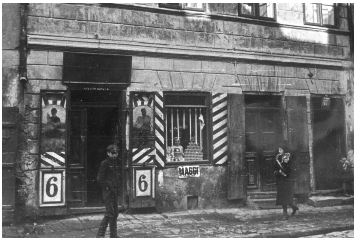
Szeroka 6, autor Stefan Kielsznia, ok. 1938, własność Jerzego Kielszni.