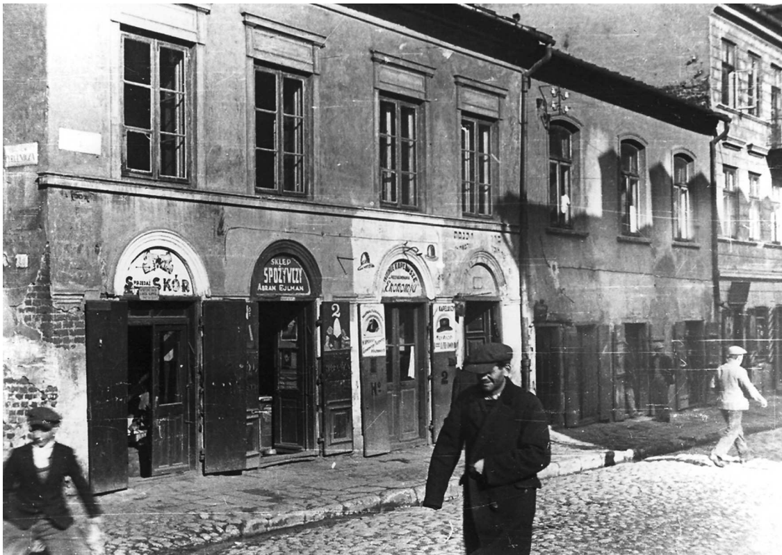
Szeroka 6, fragment kamienicy trzeciej od lewej, autor Stefan Kielsznia, ok. 1938, własność Jerzego Kielszni.